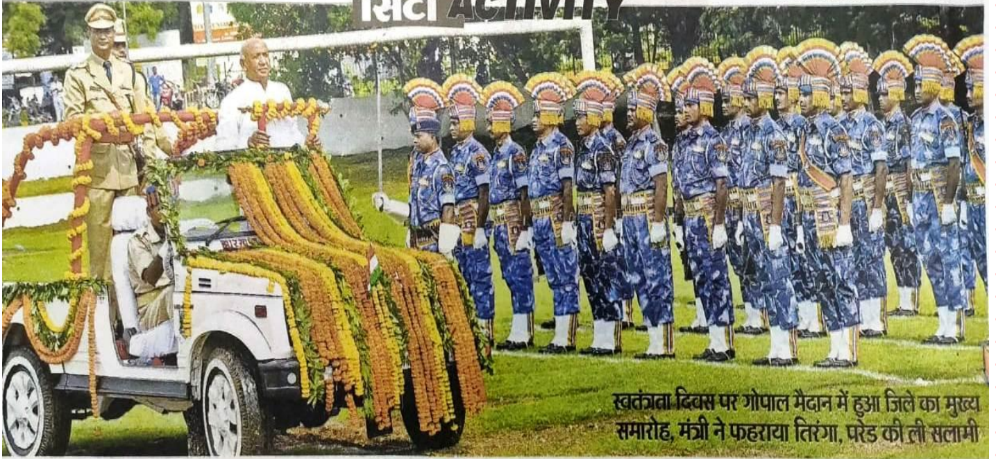
स्वतंत्रता दिवस पर गोपाल मैदान में हुआ जिले का मुख्य समारोह, मंत्री ने फहराया तिरंगा, परेड की ली सलामी