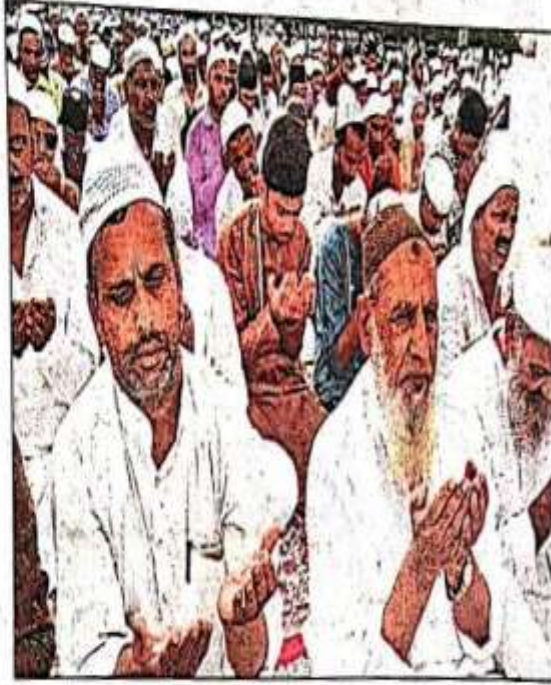
इंदगाह में बड़ी संख्या में अकीदतमदों ने नमाज अदा कर अमन की दुआ मांगी।

दिल्ली रोड स्थित शाही इंदगाह समेत शहर की मस्जिदों में सोमवार को बकरीद की नमाज अदा की गई। नमाज को शांतिपूर्ण ढंग से संपन्न करने के लिए पुलिस प्रशासन ने रुट डायवर्ट करने के साथ सुरक्षा के कड़े इंतजाम किए थे। सुबह के समय शहर के अंदर भारी वाहनों का प्रवेश बंद किया गया। सोमवार सुबह से ही फुटबॉल चौक, घंटाघर और जैन नगर की तरफ से इंदगाह की ओर से छोटे-बड़े किसी भी वाहन को प्रवेश नहीं दिया गया। सुबह से ही शाही इंदगाह पर अकीदतमदों के पहुंचने का सिलसिला शुरू हुआ। नमाज