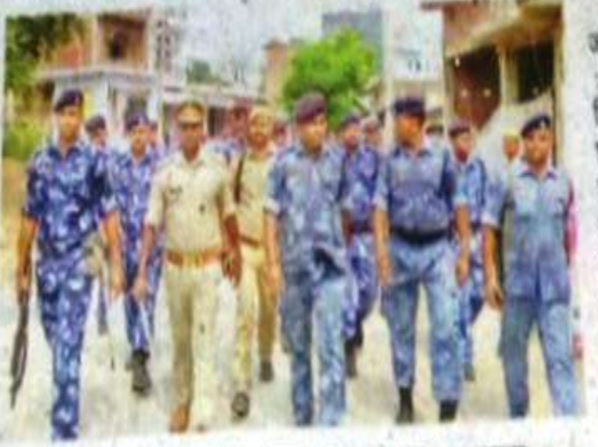
मुहम्मदाबाद मोहना के बलीपुर में रूट मार्च करते आरएफ के जवान • जगरण

नगर के लोगों को विश्वास दिलाया कि त्योहार में किसी तरह की कोई दिक्कत परेशानी नहीं आने दिया