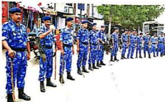
हापड़ अड्डे पर तैनात आरएफ • फाइल फोटो

जम्मू-कश्मीर से अनुच्छेद 370 हटाने पर शहर और देहात में दूसरे दिन भी जश्न का माहौल रहा। ज्यादातर लोग टीवी पर चिपके रहे हैं। अफसरों ने शहर और देहात में निकलकर लोगों के मूड को जाना है। शहर में शांति व्यवस्था को देखते हुए फोर्स आधी कर दी गई है। एक लाटून पीएसी और एक कंपनी आरएफ को भी अतिसंवेदनशील 12 प्वाइंटों पर लगाया हुआ है। भूमिया पुल, लिसाड़ी चौगहा, हापड़ अड्डा, रेलवे रोड चौगहा, कंसरगंज, शास्त्रीनगर, मोदीपुरम, नुरानपुर, इंद्रा चौक, बिजली बंबा चौकी, एल ब्लॉक चौकी और जेल चुंगी पर अभी भी थाने स्तर से फोर्स लगाई हुई है। थाना प्रभारियों को आदेश दिया गया के अपने अपने क्षेत्र में फोर्स का मूवमेंट बढ़ाए और पब्लिक के मूड को समझे। उधर, सुभारती विवि समेत कई विवि में कश्मीरी छात्रों पर खुफिया नजर बनाकर रखी गई है। सभी कॉलेज प्रशासन को