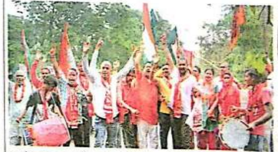
अनुच्छेद-370 समाप्त होने पर कमिश्नरी चौराहे पर खुशी मनाते शिवसैनिक