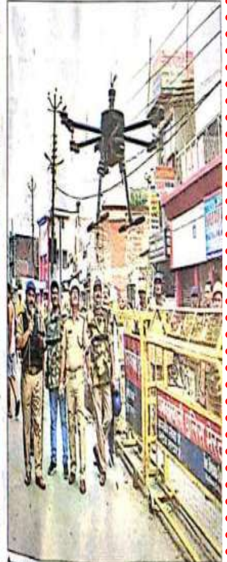
हरना कोर्ट उड़ाकर पुलिस ने पूरे इलाके पर नज़र रखी।