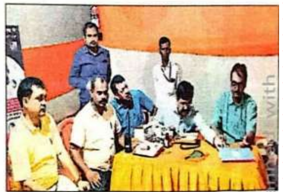
स्वास्थ्य शिविर में डॉक्टर व स्वास्थ्यकर्मी.