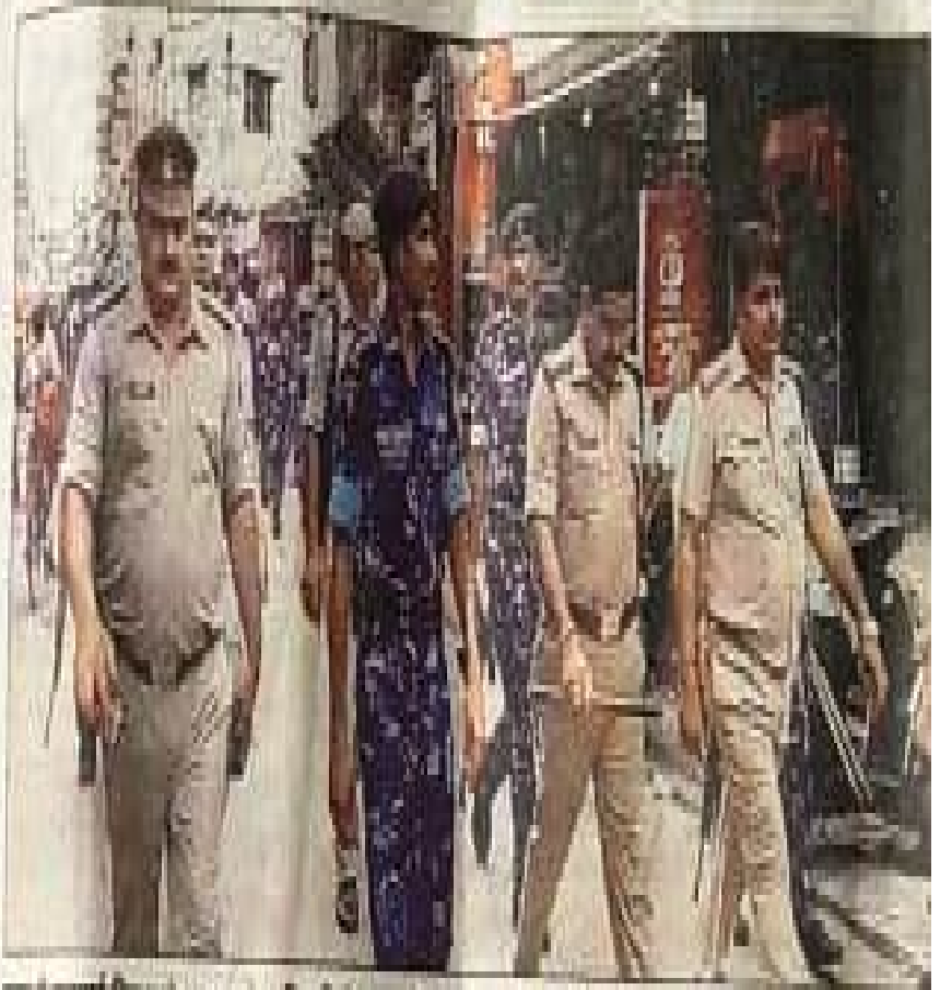
शहर में स्टेमार्च निकाला आरएफ व अधिकारियों व जनता के साथ एसी सिटी और पुलिस बल। • विद्वत्तामय

एसी सिटी के नेतृत्व में जिला तथा स्टेमार्च लालपुर से हुए हुए