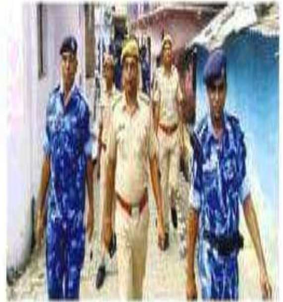
छबड़ा, कस्बे में फ्लैग मार्च निकालते रैपिड एक्शन फोर्स के जवान।