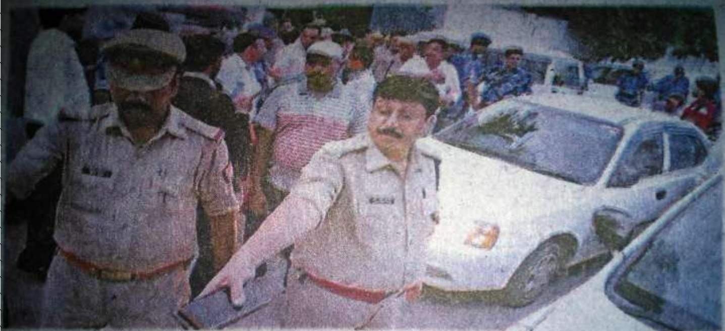
बकिया में जांच करने के बाद लौटती सीबीआइ टीम।

11 घंटे सीबीआइ ले लखनऊ पहुंचे, अतीक अगवा अगवा - 0-4