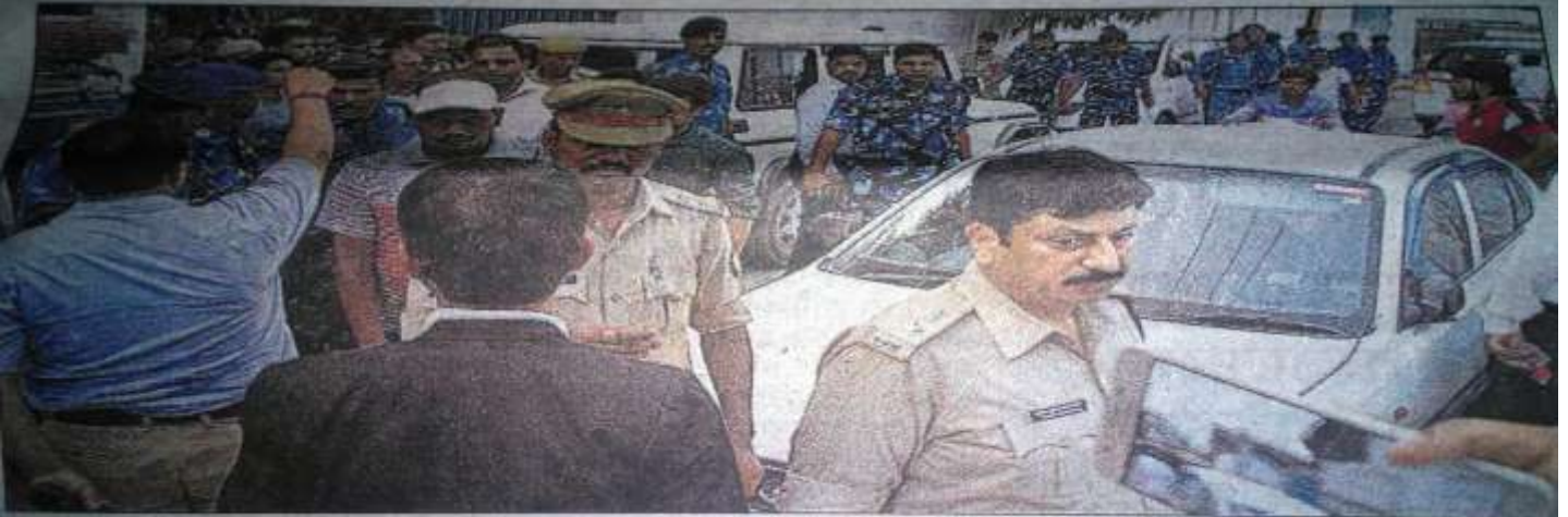
अतीक अहमद के चकिया स्थित घर से जांच के बाद शाम को बाहर निकलती सीबीआई टीम और पुलिस के अधिकारी।