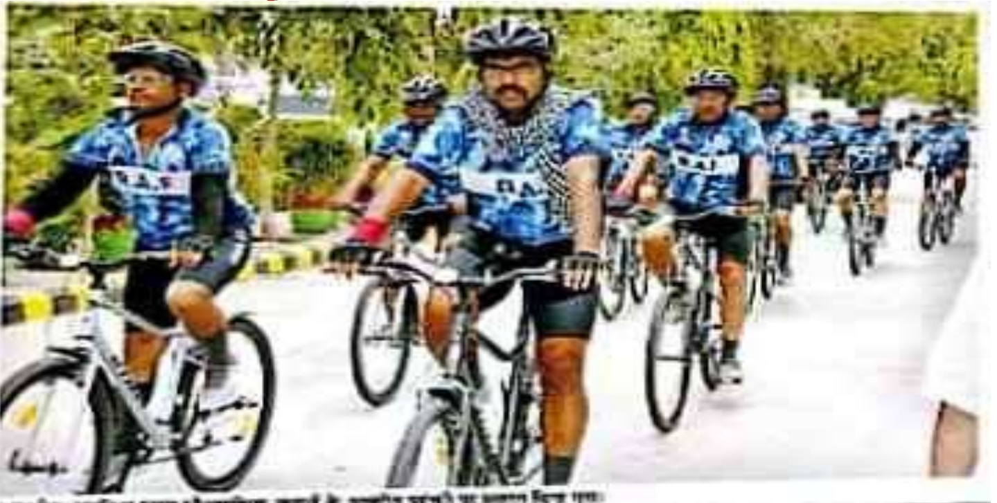
સાયકલિસ્ટોનું રંગ દે ભસંતી ગીતના તાલે કુમકુમ તિલક કરી સુતરની ઓટી પહેરાવી ભવ્ય સ્વાગત કરવામાં આવ્યું હતું.