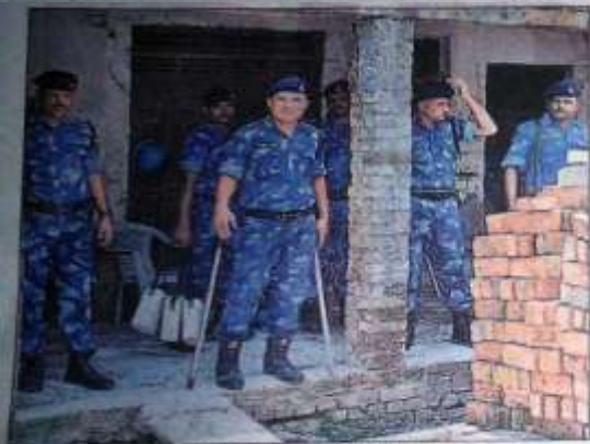
आवास के पिछले हिस्से में तेजात रहे आरएफ के जवान। • हिन्दुस्तान