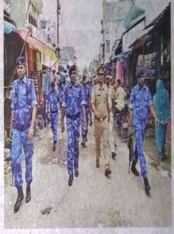
प्रयागपुर में स्थित बाबा बागेश्वरनाथ व शहर का सिद्धनाथ मंदिर और नवाबगंज क्षेत्र में फ्लैग मार्च करते एआरएफ व पुलिस के जवान • जागरण

जासे, बहराइच : सावन बुधवार से शुरू हो जाएगा। सावन भोले भंडारी का दिन माना जाता है। इस दौरान कांवड़ियों द्वारा शिव मंदिरों में जलाभिषेक किया जाता है। कांवड़ यात्रा को लेकर प्रशासन भी अलर्ट हो गया है। आरएफ व पुलिस के जवानों ने शांति व्यवस्था बनाए रखने के लिए फ्लैग मार्च किया। सावन को लेकर शिव मंदिर भी सज-धज कर तैयार हो गए हैं। व्यवस्थाएं पूरी कर ली गई हैं। पांडवकालीन शिव मंदिरों में सुरक्षा के