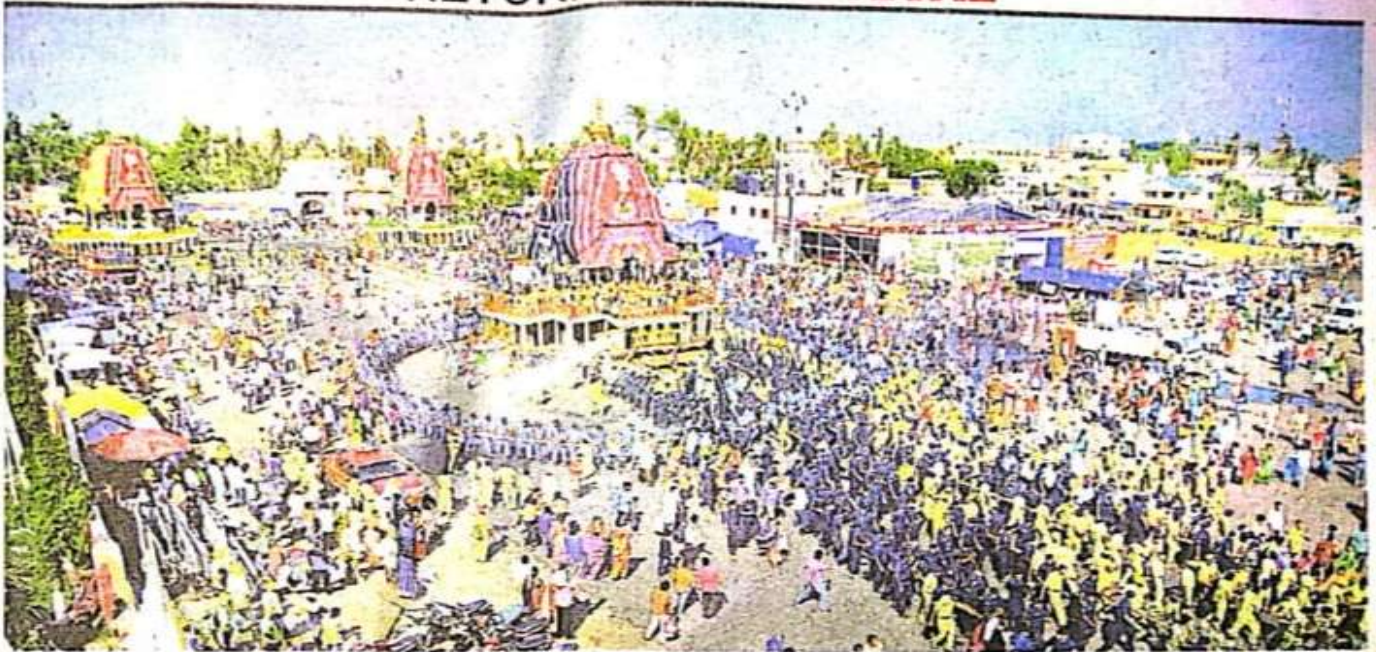
Darpadalan, the chariot of Devi Subhadra, being parked facing Srimandir in Puri as part of preparations for Bahuda Yatra of the Trinity to be conducted July 12.