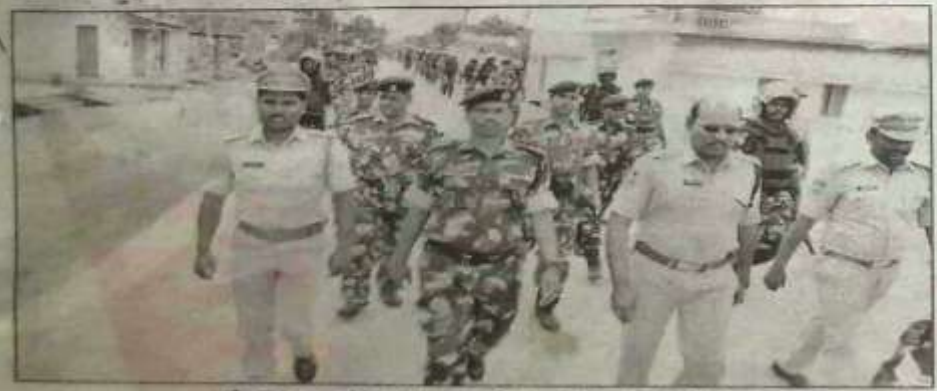
లో ఇన్ పట్టణంలో కవాతు పర్వహిస్తున్న ర్యాపిద్ యాక్షన్ ఫోకర్స్

బోధన్, సమస్తే తెలంగాణ /రెంజర్ : బోధన్ పట్ట జంలోని భారాన వీడుల్లో అధివారం స్ట్రానిక బోధన్ ఎసీపీ ఏ.రెస్లు ఇద్దర్యులలో ర్యాఫిస్ యాక్షన్ ఫోర్స్ పోలీసులు కూడా నిర్వహించారు. విర్ణణంలో త్వరలో నిర్వహించి మున్నివిత్త ఎప్పికల సందర్భంగా పోలీసు అకు తోధన్ విట్లణ పరిస్థితిస్తే అమాహన కర్యించిం మీకు ఈ కార్యక్రమం చేసుల్లారు. కనాతు పట్టణంలోని అమ్మమల్లి ముంది ప్రారంభింది శక్కర్మనుకు చారస్స్తా.