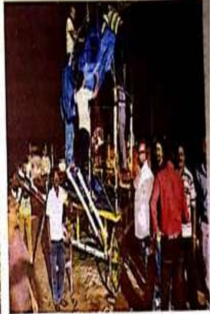
खसमन्त की रथयात्रा की तैयारी में लगे कर्मियों के सदस्य • जमशेदपुर