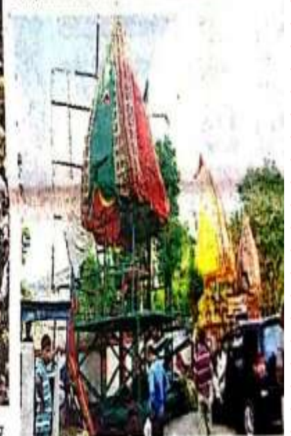
विष्णु राम मंदिर के पास चारों तरफ से रथ की सजावट करने वाले • जमशेदपुर

अंजलि के पुनी के श्रीमंदिर। जगन्नाथ मंदिर। से गुरुवार को भगवान जगन्नाथ की रथयात्रा निकलेगी। इनमें करीब पचास लाख लोगों के शामिल की संभावना है। रथयात्रा के एक दिन पहले बुधवार को रथ सजवाया जा रहा था। (जय रथ का निर्माण किया जाता है) से मंदिर के पास लाया गया। रथयात्रा से रथ मंदिर को ले जाते प्रभु • जमशेदपुर