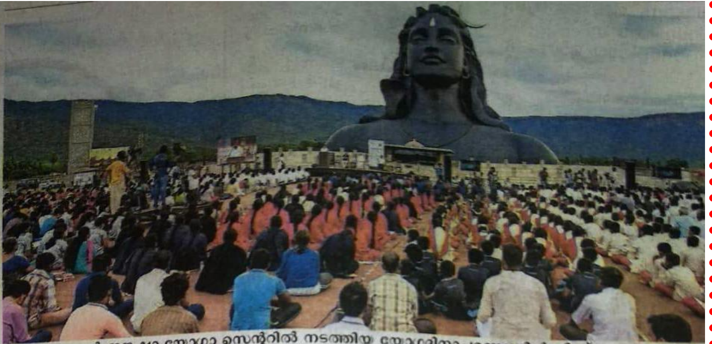
കോയമ്പത്തൂർ ഈശാ യോഗ സെന്ററിൽ നടത്തിയ യോഗദിനാചരണത്തിൽ നിന്ന്.