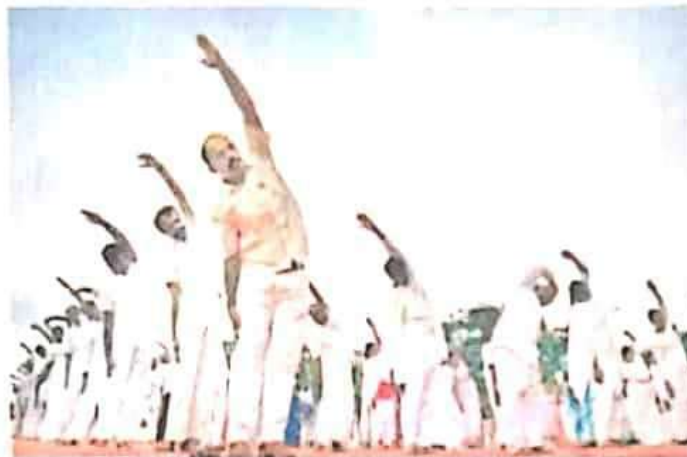
Participants perform yoga on the occasion of International Yoga Day organised by Brahma Kumaris at VOC Park in the city on Friday.

Sri Ramakrishna Matriculation Higher Secondary