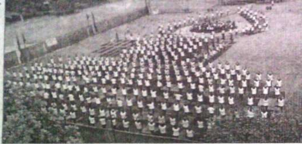
योगाभ्यास करते १०१ हुत कार्य बल बाहिनी के जवान एवं उनके परिजन।