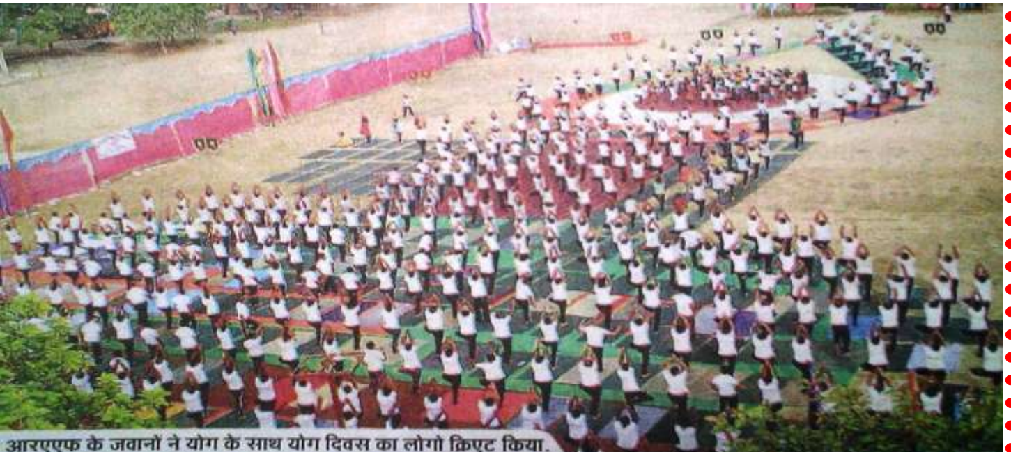
आरएफ के जवानों ने योग के साथ योग दिवस का लोगो क्पिंट किया.