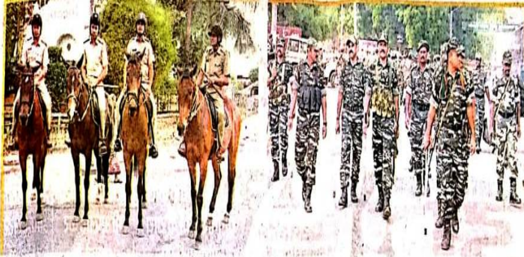
महावीर स्टेडियम के बाहर घोड़ा पुलिस तैनात व मार्च करते सुरक्षाकर्मी।