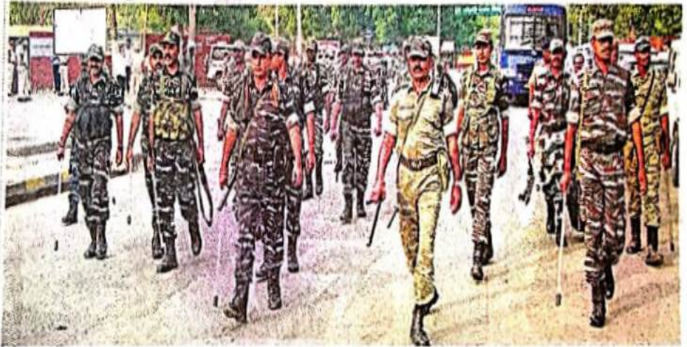
लोकसभा चुनाव में मतगणना केंद्र के बाहर गश्त करते अर्द्धसैनिक बल के जवान।

चुनाव आयोग के दिशा-निर्देश के साथ पुलिस और जिला प्रशासन ने हर मोर्चे पर अलर्ट रहते हुए लोकसभा चुनाव-2019 शांतिपूर्ण संपन्न तरीके से संपन्न करवाए। मतदान और मतगणना शांतिपूर्वक तरीके से संपन्न हुई। जिस तरह मतदाताओं ने निर्भीक होकर मत का प्रयोग किया, वहीं गुरुवार को हुई मतगणना के वक्त राजनीतिक पार्टियों के नेताओं और कार्यकर्ताओं ने संयम रख हर-जीत को स्वीकार किया। लॉ एंड ऑर्डर मैनटेन रखने के लिए अर्द्धसैनिकों के साथ पुलिस कर्मियों ने मोर्चा संभाले रखा। महावीर स्टेडियम, पंचायत भवन और गिरी सेंटर में बने मतगणना केंद्रों को 14 नाकों से सील कर दिया था।