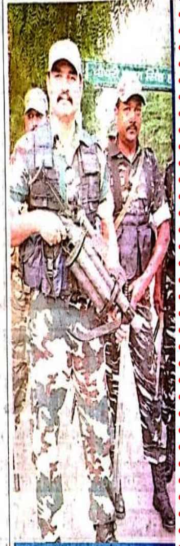
महावीर स्टेडियम के बाहर तैनात सुरक्षाकर्मी।