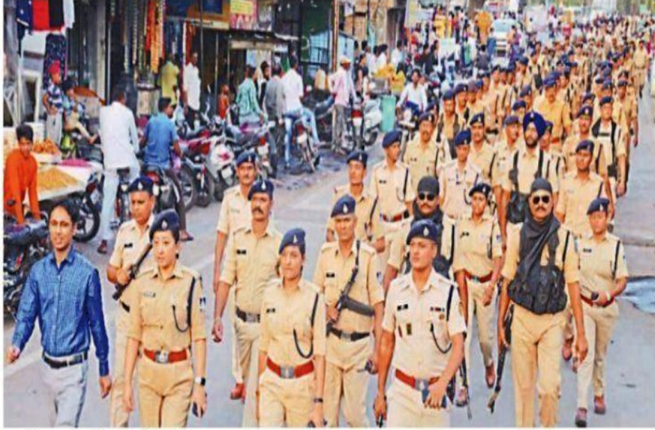
बड़वानी. चुनाव के पूर्व निकाला फ्लैग मार्च।