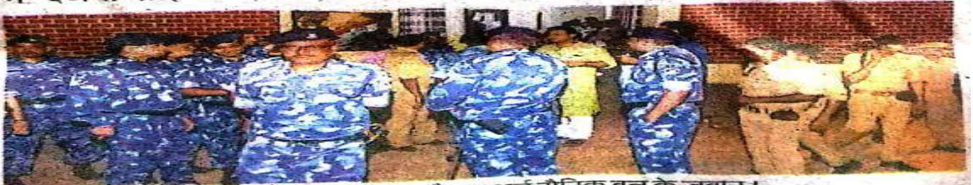
प्रियदर्शनी हॉस्टल में छापेमारी के दौरान मौजूद अर्द्ध सैनिक बल के जवान।