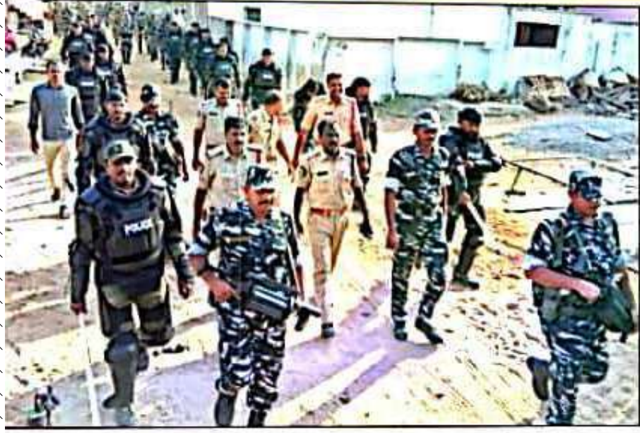
ఫ్యాజిల్ గ్రామాల్లో సాయుధ బలగాలతో కూచు విద్యపాస్టర్స్ డీఎస్పీ