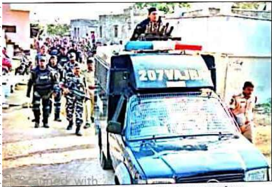
ప్రత్యేక బలగాలతో భద్ర వాతావరణంలో తిరుగుతున్న పోలీసులు

జమ్మలమడుగు రూరల్ , ఏప్రిల్ 08 ( ప్రజా న్యూస్ ) ఈ నెల 11వ తేదీ గురువారం నాడు జరుగబోయే సార్వత్రిక ఎన్నికల్లో ఓటు యే ఎలాంటి ప్రలోభాలకు పాల్పడకుండా ప్రశాంత వాతావరణంలో తమ ఓటు హక్కును వినియో గించుకోవాలని జమ్మలమడుగు డీఎస్పీ కోలాక్రిష్ణన్ పేర్కొన్నారు. మంగళవారం డీఎస్పీ కోలాక్రిష్ణన్ ఆధ్వర్యంలో ఆర్డర్స్, రూరల్ పీఠాలు, ప్రత్యేక పోలీసు బంగాలతో జమ్మలమడుగు పట్టణం, మండలంలోని సమస్యాత్మక గ్రామాల్లోని గిరిగి నూరు, ధర్మాపురం, సుగమంబిరుల్లి, పెద్ద దండ్లూ రు, సున్నపురాళ్లపల్లి గ్రామాల్లో ప్రత్యేక బల గాలతో ఆలాగే లోబో పోలీసు బంగాలతో కవారు నిర్వహించారు. ఈ సందర్భంగా గ్రామాల్లోని అణువణువు క్షణంగా పరిశీలించారు గ్రామాల్లోని గడ్డి వాముల్లో, ఇండ్లలో, ప్రతి వీడిలో పరిశీలించారు. ఈ సందర్భంగా డీఎస్పీ మాట్లా డుతూ ఎన్నికల సమయంలో గ్రామంలో ఎవరూ అవాంఛనీయ సంఘటనలు పాల్పడవద్దని, ఆలా చేస్తే ఎంతటి వారివైనా ఉపేక్షించేది లేదని ప్రశాంత వాతావరణంలో ఓటు హక్కును వినియో గించుకోవాలని పేర్కొన్నారు. మద్యం సేవించి అల్లదకు పాల్పడితే ఎంతటి వారివైనా పదిలేది లేదన్నారు. ఖిందోవర్ డిపూలు నెమోలైన వ్యక్తుల మీద ఎప్పుడోప్పువారు సహా ఉంచడం జరుగు తుందని రెచ్చగొట్టే మాటలు, పార్టీల వర్గాలుగా ఏర్పడి గొడవలు పెట్టుకుంటే తరిస చర్యలు తీసుకుంటామని గ్రామస్థులకు తెలిపారు. పోలీస్ డిండ్రాల వద్ద గుంపుల గుంపులుగా ఉండవద్దని, రూపా లోంటి ఓటు హక్కును సద్వి నియోగం చేసుకోవాలన్నారు. కాబట్టి ప్రజలు పోలీసు వారికి పూర్తి సహాయ సహకారాలు అందించాలని ఆయన కోరారు. ఈ కార్యక్రమంలో ఎస్ఐలు, సిబ్బంది, ప్రత్యేక బంగాలు, తదితరులు పాల్గొన్నారు.