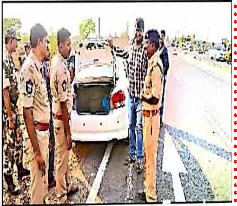
జమ్మలమడుగు పట్టణ శివారులో వాహనాన్ని తనిఖీ చేస్తున్న పోలీసులు

మద్యం తదితర వస్తువులపై నిఘా పెట్టామన్నారు. నలుగరు సీఐలు, ఏడుగురు ఎస్సైలు, పోలీసులు, సీఆర్పీఎఫ్ బలగాలు తనిఖీల్లో పాల్గొన్నారని చెప్పారు.