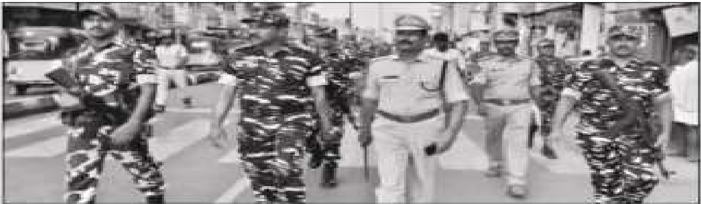
పట్టణంలో పోలీస్ కవాతును నిర్వహిస్తున్న ధృశ్యం