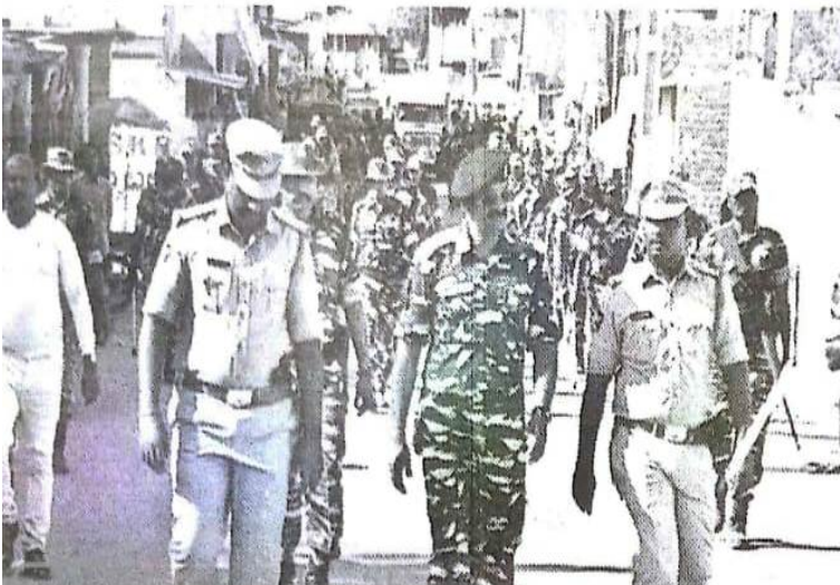
నాగం, సోమల మండలాలో ఆర్పీఎస్, పోలీసు సిబ్బంది కవాతు నిర్వహిస్తున్న దృశ్యం