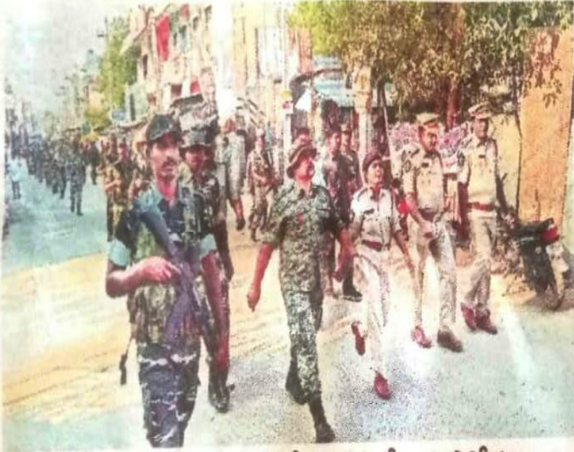
నాగలాపురం బజారు వీధుల్లో కవాతు చేస్తున్న పోలీసులు