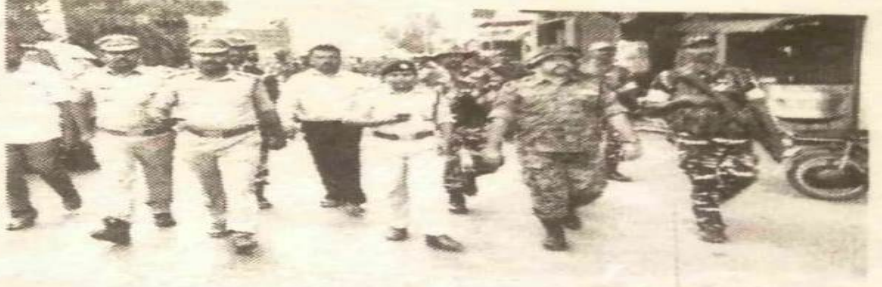
సత్యవేడు పట్టణంలో కవాతు నిర్వహిస్తున్న పోలీసు, ప్రత్యేక బృందాలు

సత్యవేడు నియోజకవర్గం ఎన్నికలు పూర్తిస్థాయిలో ప్రశాంతంగా నిర్వహించేలా పోలీసులు, అధికారులు పటిష్ట చర్యలు చేపడుతున్నారు. ఈ నేపథ్యంలో నియోజకవర్గ పరిధిలోని అన్ని గ్రామాలపై విచారణ చేసి, పలు పోలింగ్ స్టేషన్ పరిశీలించారు. గత ఎన్నికల సమయంలో తలెత్తిన సంఘటనలు, ఎక్కడ శాతం పోలైన ఓట్లను పరిగణనలోకి ఈసుకుని సమస్యాత్మకమైన పోలింగ్ కేంద్రాలపై అధికారులు దృష్టి సారించారు. నియోజకవర్గంలో సత్యవేడు, నాగలాపురం, పిచ్చాటూరు, నారయణవనం, కెవిబిపురం, బుచ్చినాయుడు కండ్రిగ, వరదయ్యపాళెం మండలాల్లో 659 గ్రామలు ఉండగా వీటిలో 279 పోలింగ్ కేంద్రాలు ఉన్నాయి. అమ్మలో సమస్యాత్మకమైనవి 9 కేంద్రాలు గుర్తించారు.