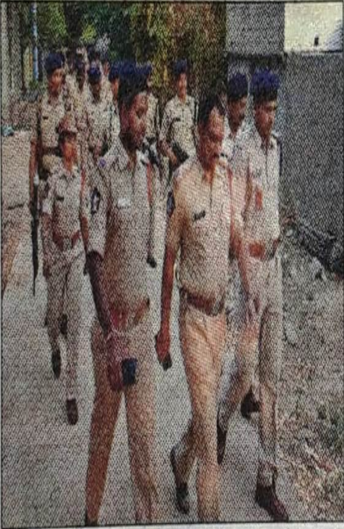
కవాతు నిర్వహిస్తున్న పోలీసు బలగాలు