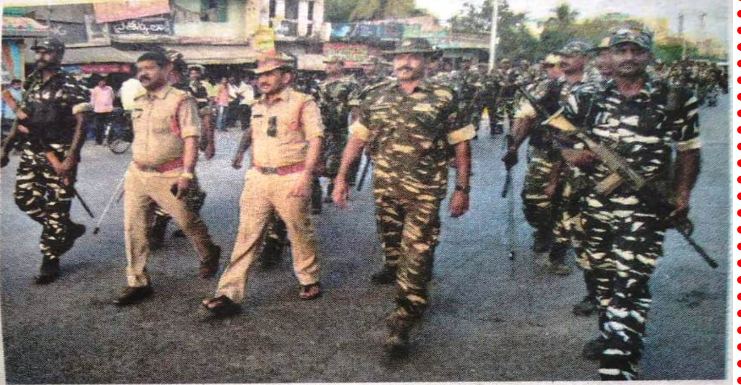
గిద్దలూరులో కవాతు నిర్వహిస్తున్న సీఆర్పీఎఫ్ జవాన్లు, సీఐ, ఎస్ఐ