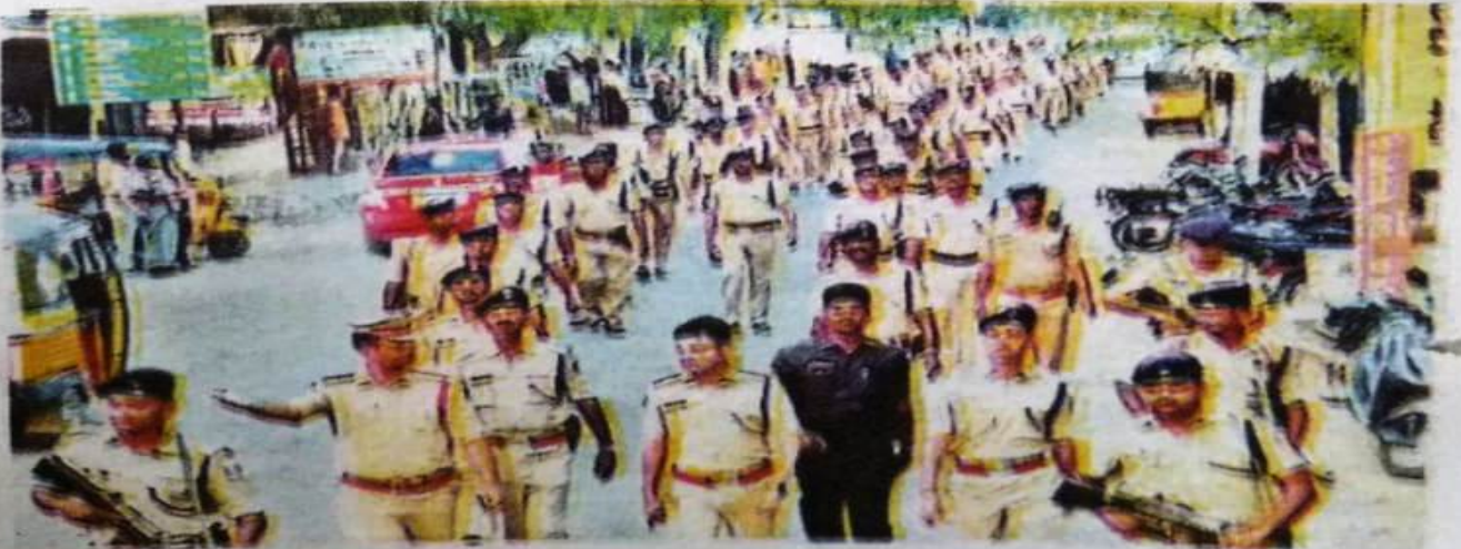
కమలాపురం పట్టణంలో కవాతు నిర్వహిస్తున్న పోలీసులు