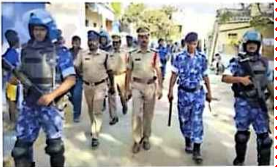
సీవ ఆధ్వర్యంలో కవాతు నిర్వహిస్తున్న రాపిడ్ యాక్షన్ పోలీసులు

మంత్రాలయం, ఫిబ్రవరి 9: మంత్రాలయంలో సీవ రవీంద్ర, ఎస్ఎ నాగేంద్ర ఆధ్వర్యంలో శనివారం రాపిడ్ యాక్షన్ ఫోర్స్ పోలీసులు కవాతు నిర్వహించారు. దాదాపుగా 70 మంది రామచంద్ర నగర్, విజేంద్ర నగర్, పాతవూరు, సంత మార్కెట్ ప్రధాన వీధుల్లో కవాతు చేశారు. ఎన్నికలు సమీపిస్తున్న తరుణంలో కవాతు నిర్వహిస్తున్నట్లు సీవ పేర్కొన్నారు.