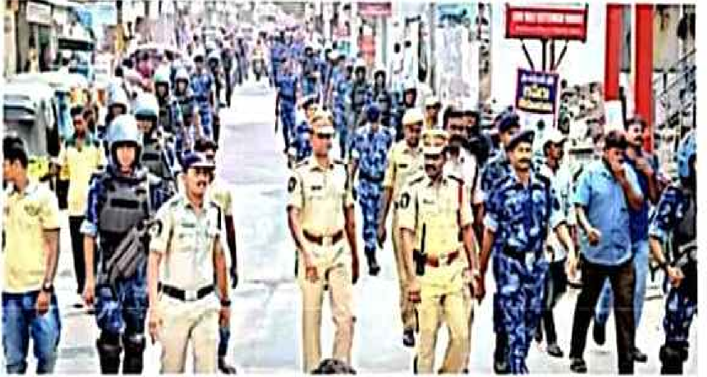
పాతబస్తాండ్లో కవాతు నిర్వహిస్తున్న ఆర్పీఎఫ్, పోలీసులు