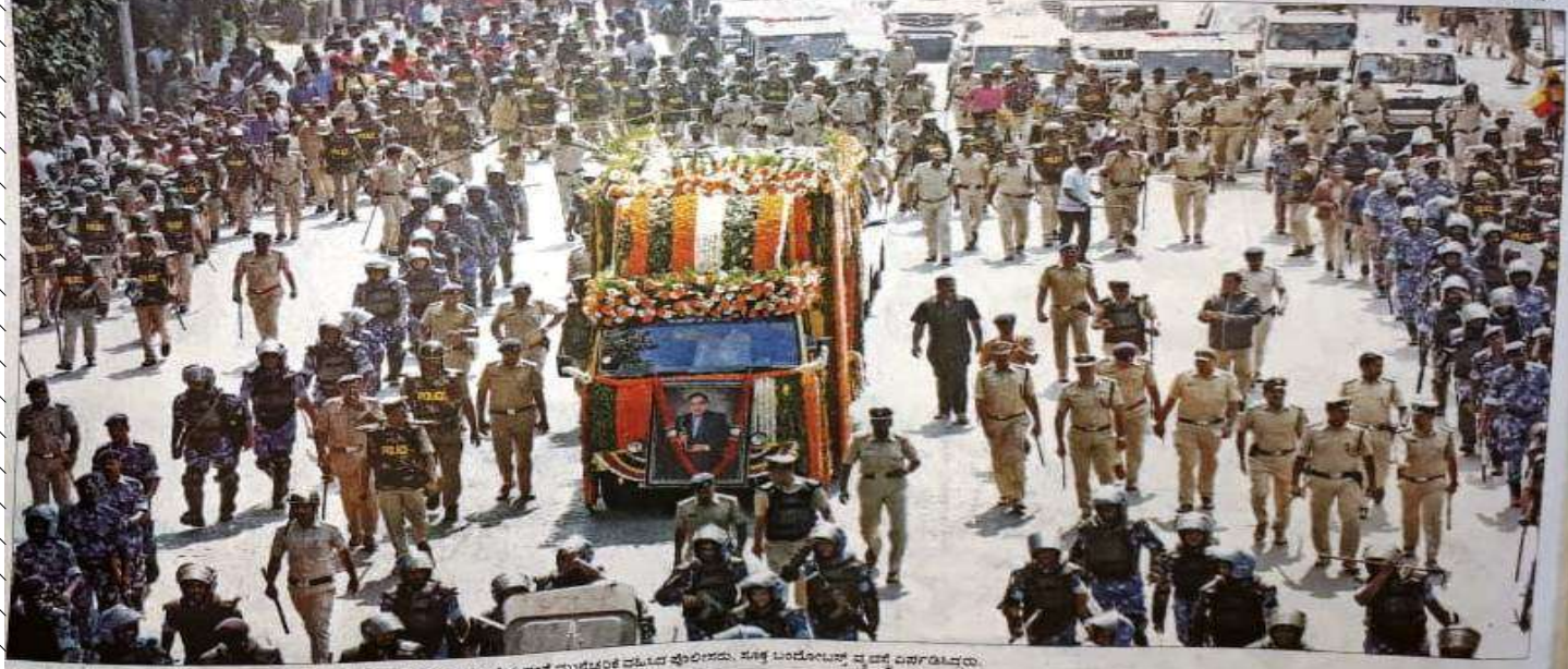
మరియ నట అంబరీష్ అదర అంతిమయాత్ర, హాం యావ్దలో అఱితర ఫాటనే నడదయదంతే ముక్కొక్కర వఱిద వూరిదయ, నీక డండోలూవ వ్ద వ్ద వనగఱువ్దయ.

13 కి.మీ. మేరవణి గే లుద్దక్కూ నడదే సాగిద హేఱ్ఱువరి పోలీస్ ఆయుక్కరు | అఱితర ఫాటనే నడదయదంతే కఱ్ఱిఱ్ఱర