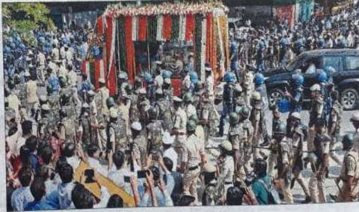
పోలీసు భద్రత మధ్య అంబరీష్ అంతిమయాత్ర

సాక్షి, బెంగళూరు: రెబెల్స్టార్ అంబరీష్ అంత్యక్రియల్లో అవాంఛనీయ ఘటనలు జరగకుండా పోలీసులు కట్టుదిట్టమైన భద్రత చేపట్టారు. అంతిమ యాత్ర వెళ్లే దారిలో భారీగా బందోబస్తును ఏర్పాటు చేశారు. ఆ మార్గంలో వాహన రాకపోకలను నిషేధించారు. మండ్య నుంచి సైనిక హెలికాప్టర్ ద్వారా పార్శ్వదేహాన్ని హెచ్ఎఎల్ విమానాశ్రయానికి, అక్కడి నుంచి కంఠీరవ స్టేడియానికి తీసుకొచ్చారు. కంఠీరవ స్టేడియం నుంచి మధ్యాహ్నం 12.30 గంటలకు అంతిమ యాత్ర ప్రారంభమైంది. హడ్సన్ సర్కిల్, హలసూరు గేట్-కేజీ రోడ్డు-ఫైసూర్ బ్యాంకు సర్కిల్-ప్యా