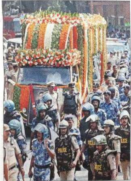
బెంగళూరులో ప్రత్యేక వాహనంలో సాగుతున్న అంతిమయాత్ర