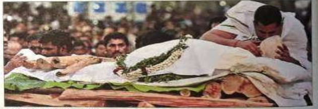
కంఠరవ ముద్దారుతున్న అంబరీష్

బెంగళూరులో అభిమానులు పోలికలతో స్ఫూడియో బయట బ్యాంకెట్లను ఏర్పాటు చేశారు. అభిమానులు అంత్యక్రియలను వీక్షించేందుకు వీలుగా నాలుగు రోజుల పాటు డివీలను ఏర్పాటు చేశారు. అంత్యక్రియలు జరిగిన స్థలంలో కుటుంబ సభ్యుల కోసం 300 కుర్చీలు, సిని, రాజకీయ ప్రముఖుల కోసం 2 వేలకు పైగా కూర్చీలను ఏర్పాటు చేశారు.