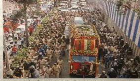
బెంగళూరులో సాగిపోతున్న అంతిమయాత్ర