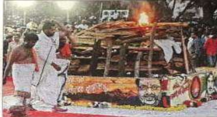
అంబరీష్ చికి చుట్టూ ప్రదర్శింపబడిన అంబరీష్