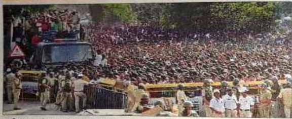
కంఠరవ స్ఫూడియో వద్ద లాఠాసులు