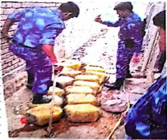
नगर संवाददाता। रीवा

शराब के मामले में एक सटीक सूचना मिलने पर सीआरपीएफ जवानों के साथ आबकारी विभाग की टीम ने दबिश दी। चाकघाट के मल्लहती टोला में हुई इस कार्यवाही से हड़कंप मच गया। भारी बल के साथ पुलिस यहां पहुंची और घरों की तलाशी लेकर