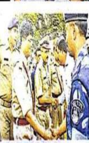
इन्होंने दौड़ में लिया हिस्सा र.क. आइआरबी, छह हजार विद्यार्थी, प्रशासनिक अधिकारी, पुलिस अधिकारी, कारोबारों के अलावा 12 राज्यों के एकलक्ष्य विद्यालय विद्यार्थी