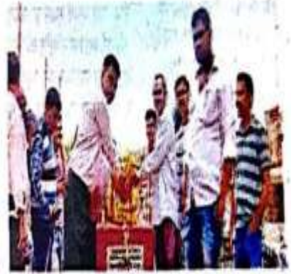
जयंती पर सरदार पटेल की प्रतिमा पर माल्यार्घ्य करने इत्तुम करारंजरी • जबरदस्त