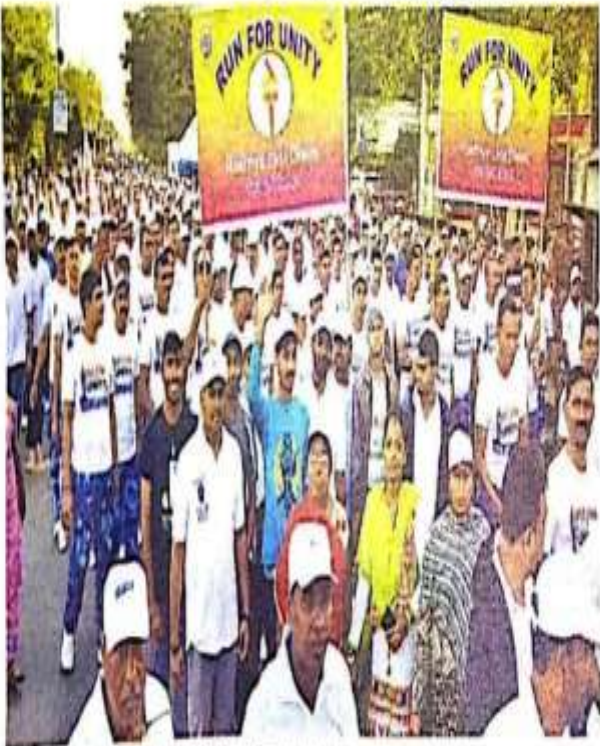
बुधवार को बारीडीह चौक से शुरू हुई रन और यूनिटी में शामिल शहर के लोग • जबरदस्त