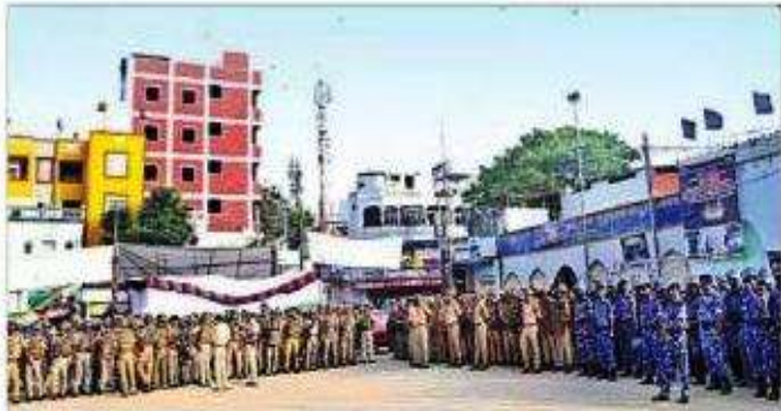
ఫ్లాగ్ మార్చ్ లో పాల్గొన్న పోలీసు బలగాలు