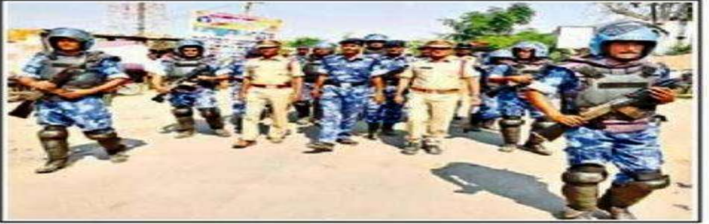
పీఠుల్లో కవాతు నిర్వహిస్తున్న బలగాలు చిత్రంలో సీఐ, ఆర్ఎఫ్ఎఫ్ ఏసీ ఎస్ఐలు