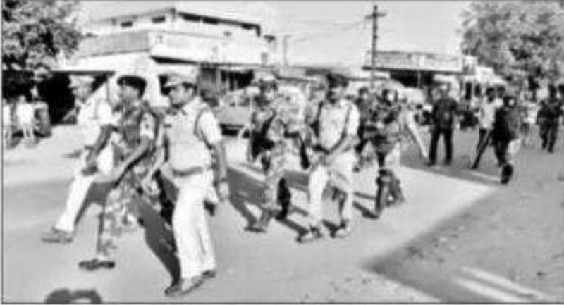
ఇంద్రవెల్లిలో కవాతు నిర్వహిస్తున్న పోలీసులు