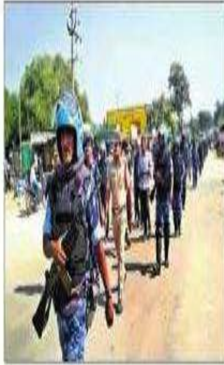
ఉత్పూర్: కవాతు నిర్వహిస్తున్న పోలీసులు

ఇంద్రవెల్లి: త్వరలో అసెంబ్లీ ఎన్నికల దృష్ట్యా ప్రజాల్లో భరోసా కల్పించేందుకు సోమవారం