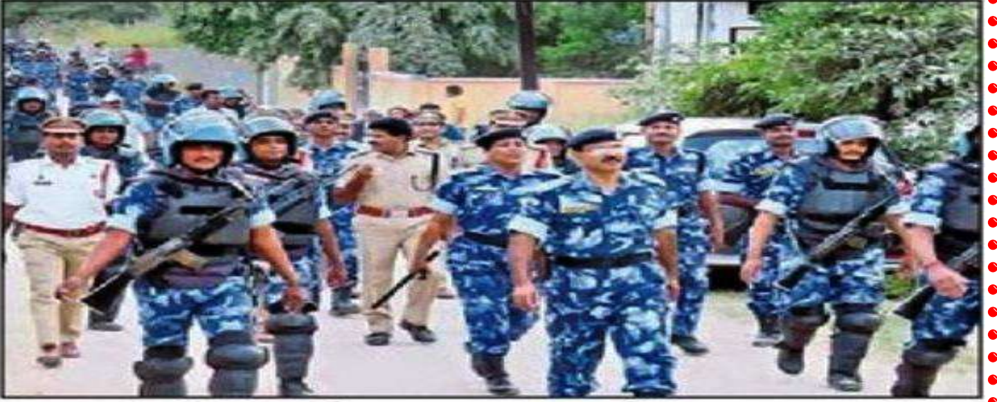
పిట్టల్వాడలో సాయుధ పోలీసుల కవాతు