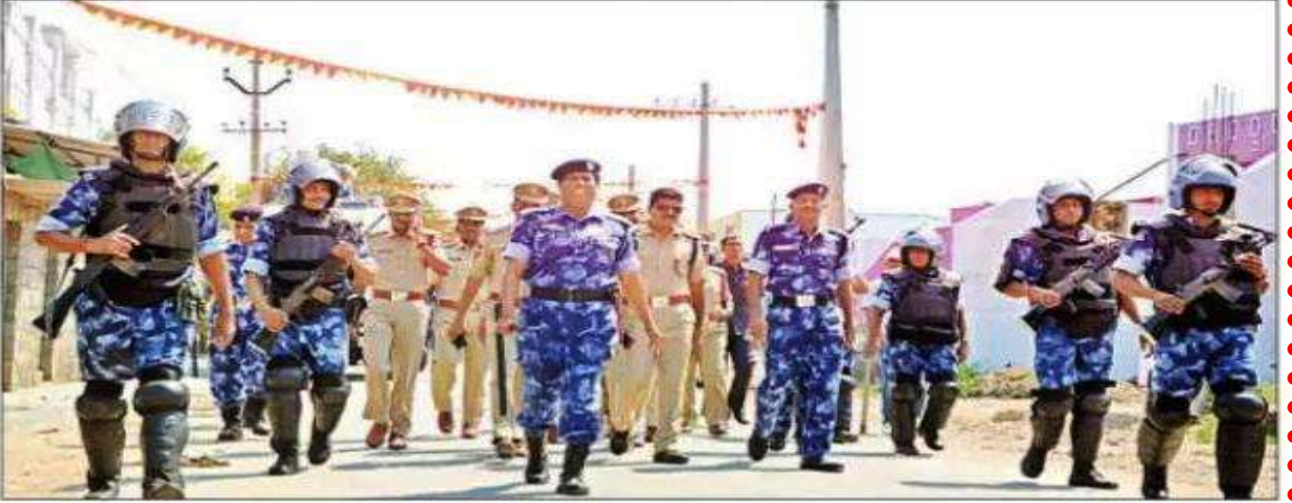
జిల్లా కేంద్రంలో కవాతు నిర్వహిస్తున్న కేంద్ర బలగాలు

» జిల్లా కేంద్రంలో కవాతు నిర్వహించిన కేంద్ర సాయుధ బలగాలు