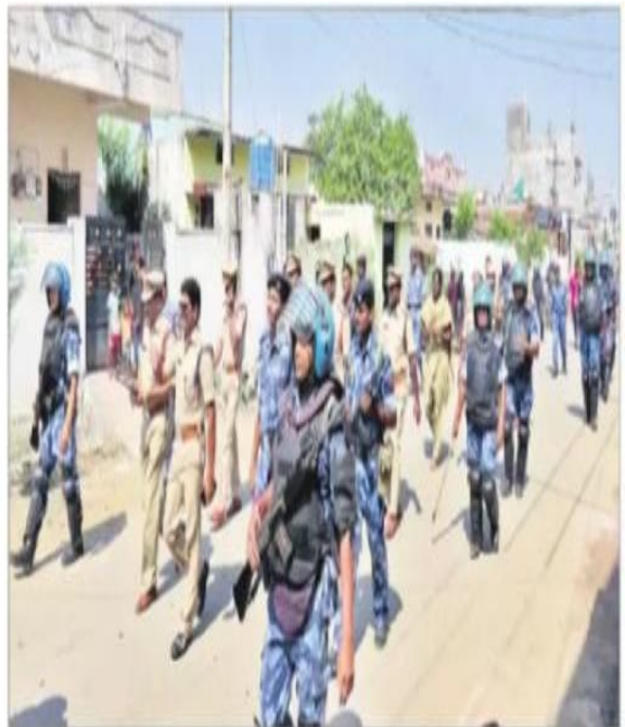
పట్టణంలో కవాతు నిర్వహిస్తున్న కేంద్ర బలగాలు