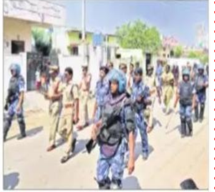
సాయుధ బలగాలతో పట్టణంలో ర్యాలీ నిర్వహిస్తున్న దృశ్యం