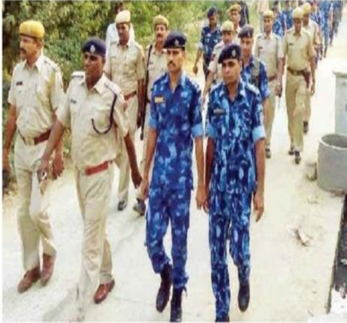
దోసా కే కుండ్ల గాంవ మేం ఫలैగ మార్చ కరతే జవాం.

చునావోం కి దృషి సే దోసా అతిసంవేదనశీల హే, అతిసంవేదనశీలతా క్షా సబసే బడై ఉదాహరణ హే కి దేశా మేం అబ దో బగడ ట్రై పోల కి ఖటనాం హుం హే, దోనో ఖటనాం హీ దోసా జిలె మేం హుం హే. యాం పర 1996 మేం జీగ ఆరి 2009 మేం గోటడై మతదాన కేంద్ర పర ట్రై పోల కి ఖటనాం హుం ఖి. ంసే మేం శాతిపూర్ణ చునావ కరణానా పులిస కే లింప చునోతి బనా హుం హే. హలాంక పులిస ఖి ంస చునోతి కి సవీకారతే హుం సక్రియ నజర ఆ రహి హే. దోసా