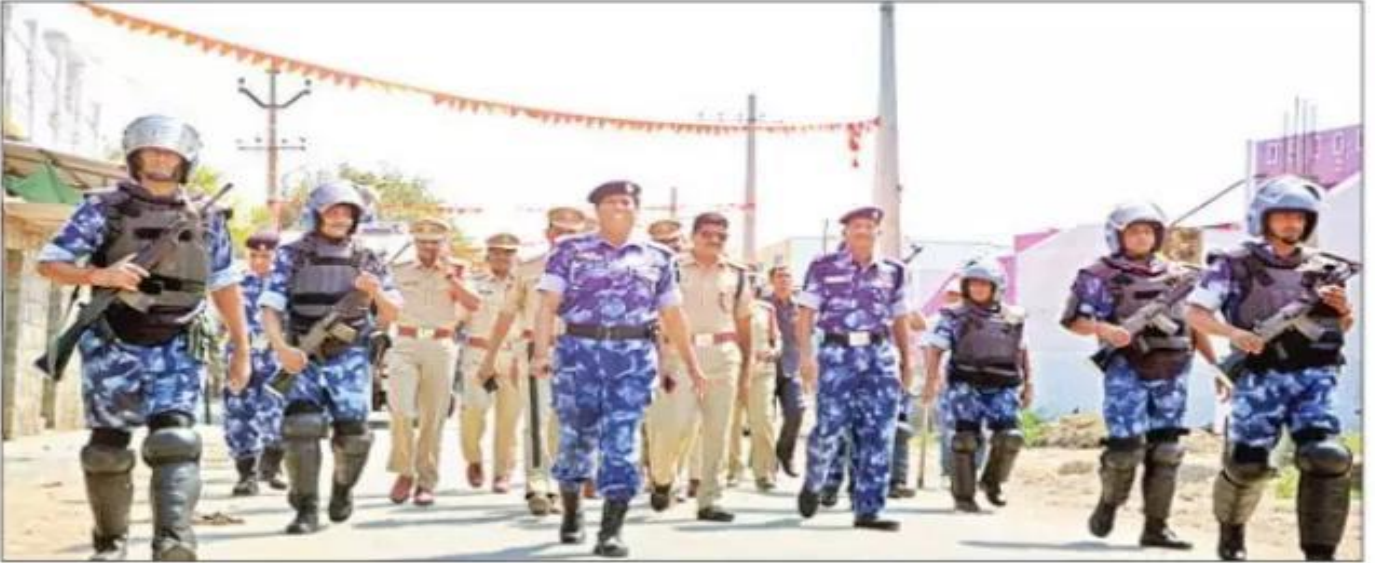
జిల్లా కేంద్రంలో కవాతు నిర్వహిస్తున్న కేంద్ర బలగాలు

» జిల్లా కేంద్రంలో కవాతు నిర్వహించిన కేంద్ర సాయుధ బలగాలు