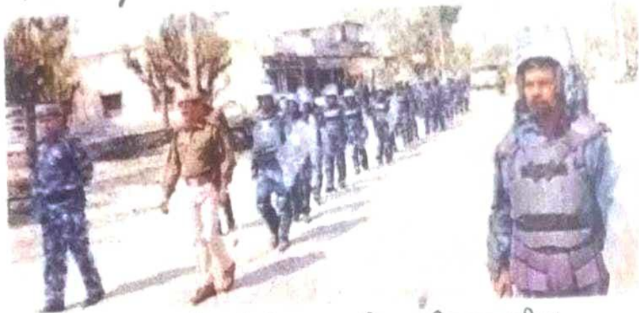
कालंद्री. कस्बे में मार्च करते डी-100 बटालियन की प्लाटून टीम।

बैठक में शांति समिति एवं थाना क्षेत्र के गणमान्य लोगों के साथ चर्चा कर अपने कार्य क्षेत्र के बारे में अवगत कराया। साथ ही भविष्य में शांतिपूर्ण माहौल बना रहे, इस पर चर्चा की। थाना क्षेत्र के अतिसंवेदनशील इलाकों की