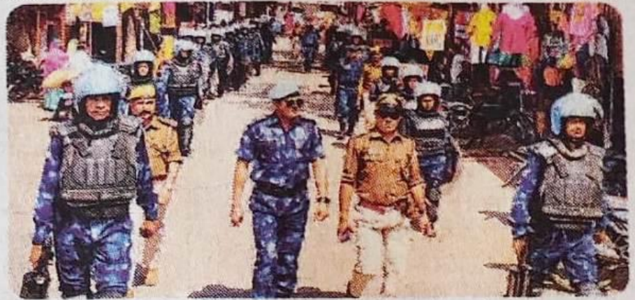
रेपिड एक्शन फोर्स व पुलिस बल नगर में फ्लैग मार्च करते हुए। आमेट

लावासरदारगढ़. क्षेत्र में कानून व्यवस्था बनाए रखने व लोगों में सुरक्षा की भावना को लेकर सोमवार को कस्बे में पुलिस एवं आरएएफ के जवानों ने संयुक्त रूप से फ्लैग मार्च निकाला। मार्च पुलिस चौकी के पास नया बस स्टैंड से रवाना हुआ, जो कस्बे के पुराना बस स्टैंड, जाटों का मौहल्ला, किला रोड सहित प्रमुख मार्गों से होकर