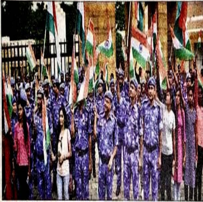
एक्सलेंट रूसी मोदी फॉर सेंटर में मंगलवार को कारगिल दिवस पर कार्यक्रम प्रस्तुत करते एनडीआरफ की टीम।

इस मौके पर श्रद्धांजलि सभा का भी आयोजन किया गया। इस दौरान वक्ताओं ने कहा कि दुनिया की सबसे ऊंची और दुर्गम चोटियों पर हुए इस महत्वपूर्ण युद्ध में भारतीय सेना के 527 जवान वीरगति को प्राप्त हुए एवं लगभग 1300 सैनिक घायल हुए थे। इतने बलिदान के बाद आज के दिन भारतीय सेना ने टाइगर हिल पर विजय पताका फहराया था। उस दिन से 26 जुलाई को कारगिल विजय दिवस के रूप में