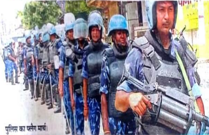
पुलिस का फलेग मार्च।

एहतिचात • मानगो हनुमान मंदिर, टेलको बारीनगर, जुगसलाई, परसुडीह इलाके में थी खास नजर