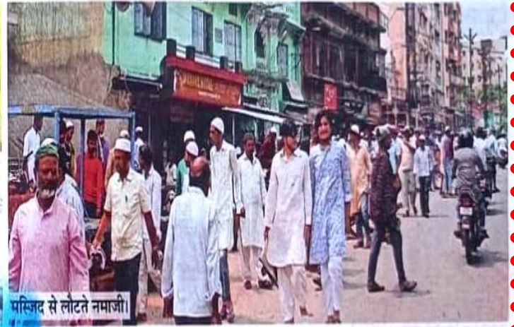
पसिजद से लोटते नमाजी।