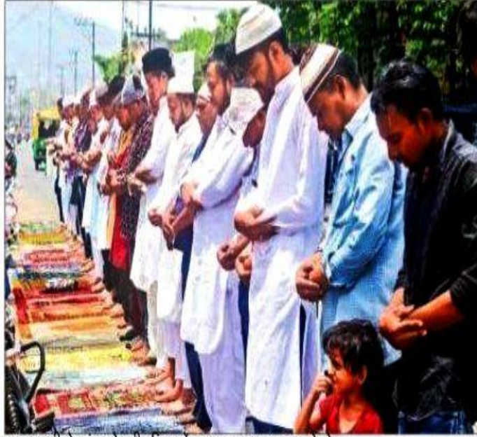
आजादबस्ती रोड नंबर दो बारी मस्जिद में सड़क पर नमाज अदा करते लोग.

शहर में अमन चैन बना रहे, इसको लेकर जिला प्रशासन शुक्रवार को पूरी तरह से चौकस रहा. धार्मिक स्थलों की सुरक्षा पर प्रशासन का विशेष फोकस रहा. जिले के 31 थाना क्षेत्रों में सुबह दस बजे से ही दंडाधिकारियों के साथ पुलिस बल की तैनाती कर दी गयी थी. संबंधित क्षेत्र के थाना प्रभारी अपनी टीम के साथ गस्त में लगे रहे. मानगो, साकची, जुगसलाई, मकदमपुर आदि क्षेत्रों में पुलिस केंद्रित रही. रैफ की दो अतिरिक्त कंपनी की तैनाती की गयी थी. मुस्लिम संगठन तंजीम अहल ए सुन्नत ने गुरुवार को ही घोषित कर दिया था कि शुक्रवार (जुमा) को नमाज के बाद कोई जुलूस नहीं निकालेंगे. तकरीर के दौरान रांची की घटना की निंदा करेंगे. लेकिन जिला प्रशासन विधि-व्यवस्था बनाये रखने को लेकर पूरी तरह से अलर्ट मोड पर था. चप्पे-चप्पे पर पुलिस बल की तैनाती की गयी थी. जुमा की नमाज के लिए लोग मस्जिदों में पहुंचे, इसके बाद अपने-अपने घरों की ओर लौट गये. हालांकि जुगसलाई में अग्निपथ मामले को लेकर कुछ विवाद अवश्य हुआ, लेकिन