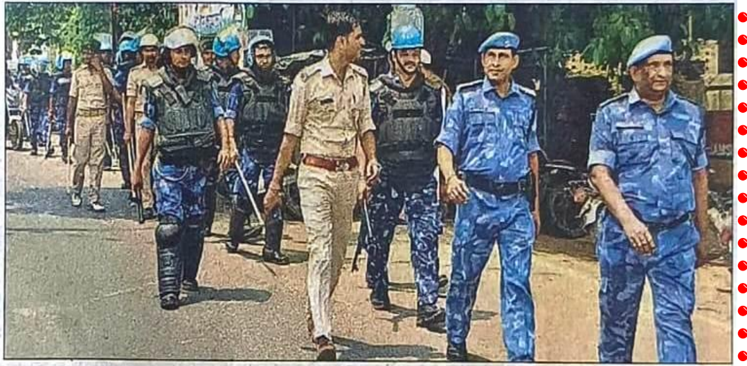
शुक्रवार को मानगो में सुरक्षा को लेकर गश्त करते पुलिस अधिकारी और रैफ के जवान।

धतकीडीह, शास्त्रीनगर में दुआ: धतकीडीह मस्जिद के बाहर भी पुलिस बल को तैनात किया गया था। तकरीर में पैगंबर मोहम्मद सल्लल्लाहो वाले वसल्लम की सीरत का बयान किया गया और कहा गया कि किस तरह से उन्हें नि सन्न किया और अमन का पैगाम दिया। शास्त्रीनगर मस्जिद के बाहर भी पुलिस बल की तैनाती थी।