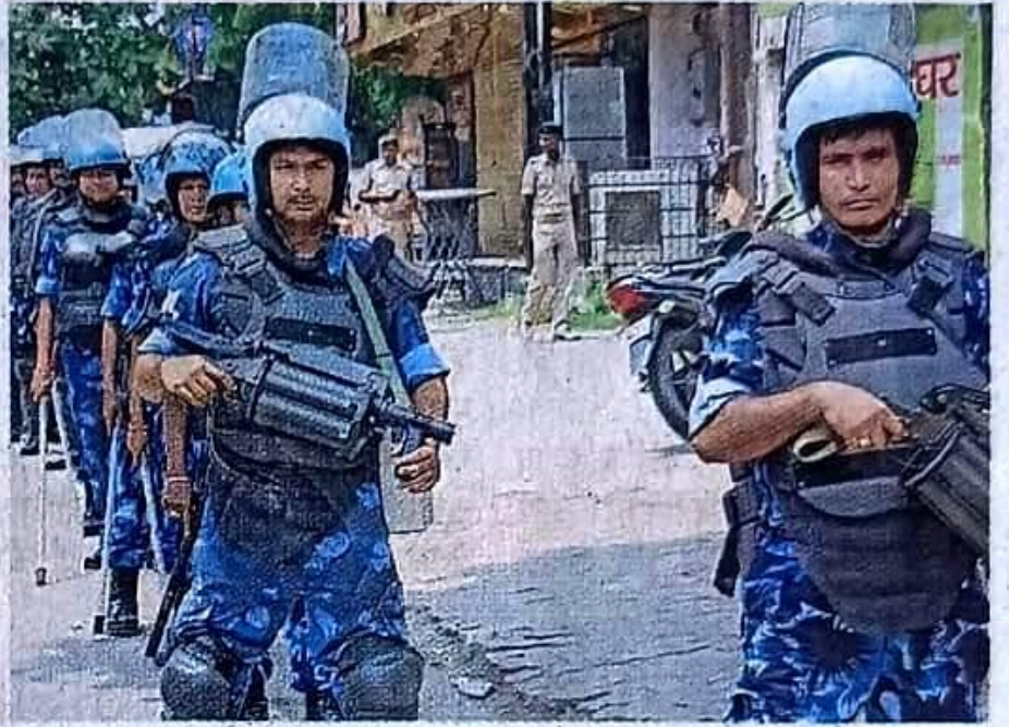
मानगो में शुक्रवार को तैनात क्यूआरटी की टीम