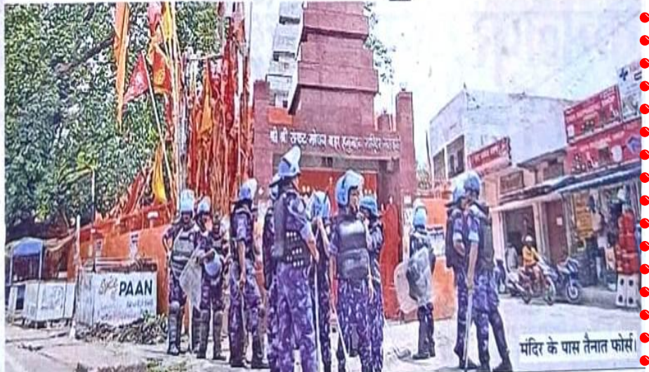
मंदिर के पास तैनात फोर्स।