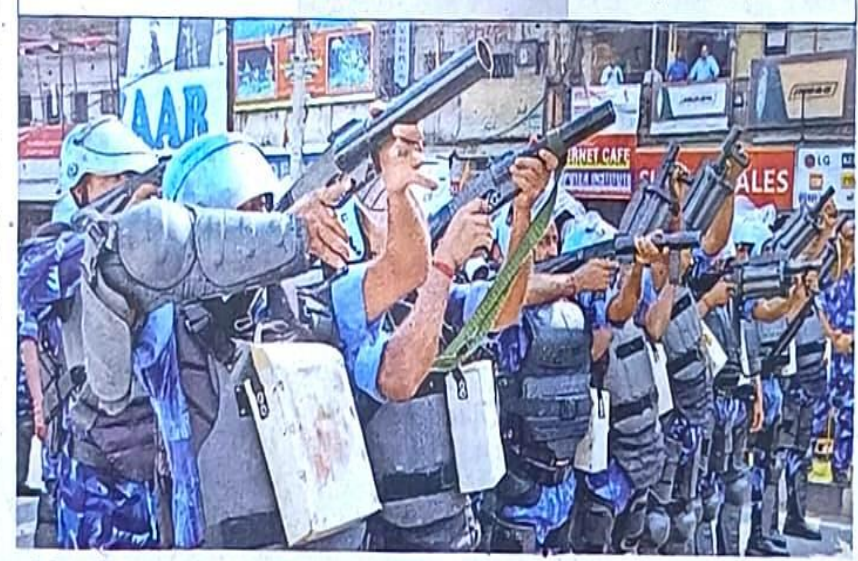
रांची के अल्बर्ट एक्का चौक पर गुरुवार को माक ड्रिल करते रैफ के जवान ॰ जागरण

अतिरिक्त वल रिजर्व 700 में रहेंगे सभी आङ्जी व डीआइजी के कार्यालय में, जिनका जरुरत पड़ने पर होगा इस्तेमाल