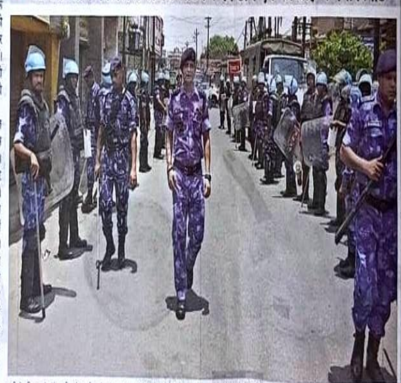
ावी में शनिवार को संवदनशील क्षेत्र कर्पना चीक के पास तैनात रेपिड एक्झन फोर्स (रेफ) के जवान । इस दौरम शहर में विभिन्न क्षेत्रों में जवान प्रतीग मार्च करते रहे 💌 जागरण

में पुलिस वल को तैनात कर दिया को मीत और दो दर्जन से अधिक रिपोर्ट राज्य सरकार को सीपिंग।