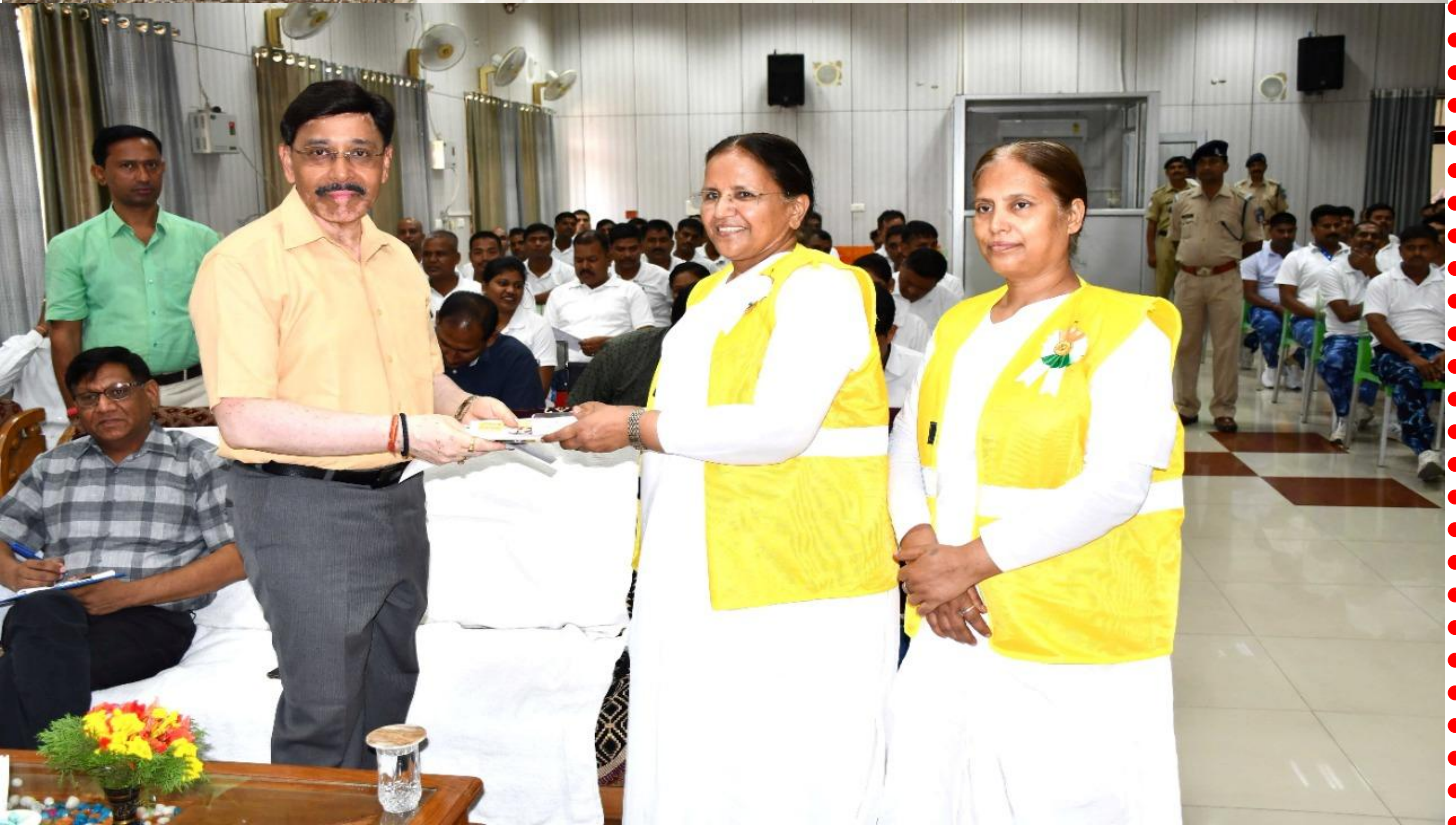
ROAD SAFETY AND MEDITATION EXERCISE PROGRAM 106BN RAF, JAMSHEDPUR (JKD)

सी०आर०पी०एफ० सदा अजेय, भारत माता की जय ।