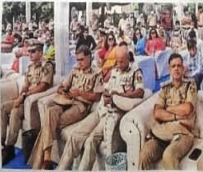
वार्षिकोत्सव में मोजूद वरिन्द पुलिस अधिकारी = माजरम

आरण्यक दरअसल. मी.आरपीएक की विग है। सात अवट्यर १९९२ को सीआरपीएक के 10 स्वाधीन बटालियन को परिवर्तित करके इसे बनाया गया वा। पहले पुरे देश में आरएएफ की १० वाहिनी वी । किलहाल १५ वाहिनी स्वापित है। देगा निवचण, भीड़ हिसा और लोक व्यवस्था के लिए आरएएक मेरठ की वाहिनी पुरे वारिवर्गी उत्तर प्रदेश में स्तम बनी है। चुनाव अदि में राज्य पुलिस के साथ आरएएक को तमाया जाता है।