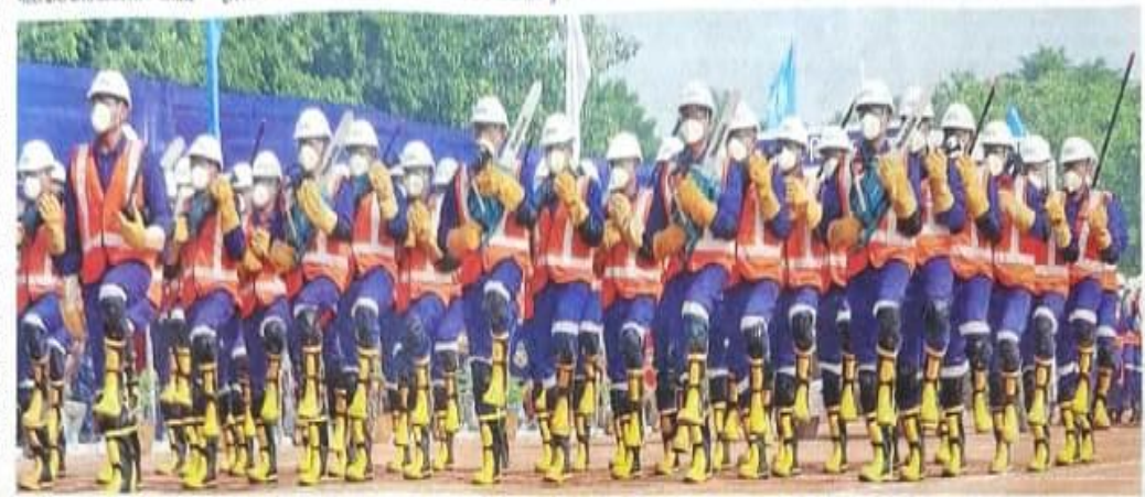
१८भवी वर्तिनी जनरएका के 29वें वर्तिकोत्सर में गुरुवार को परेत के दौरान विशेष वंशाक में बाद से राहत-सवत कार्य का प्रदर्शन करते जवान । जवानी की लवबद्धता देखते ही बन रही बी 🍨 🛲 जा जीर्य