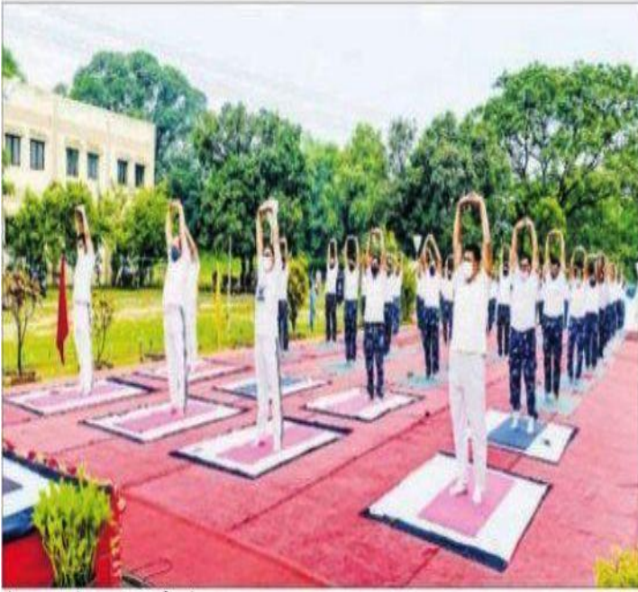
योगाभ्यास करते आरएफ 106 बीएन के जवान