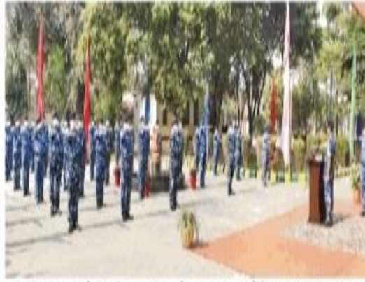
101 रैपिड एक्शन फोर्स शांतिपुरम परिसर में स्वच्छता पखवाड़े के शुभारंभ अवसर पर स्वच्छता का संकल्प लेते जवान •