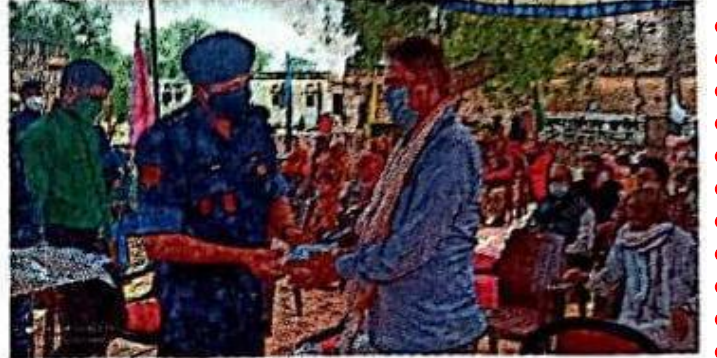
ग्रामीणों को मास्क व सेनिटाइजर बांटते हुए।