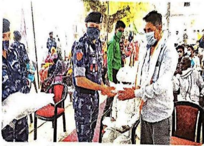
लोगों को मास्क, सैनेटाइजर एवं ग्लब्स वितरित करते हुए।

कार्यक्रम में उपस्थित लोगों को केन्द्रीय रिजर्व पुलिस बल की ओर से स्थानीय लोगों को कोरोना से बचाव के लिए मास्क, सैनेटाइजर,