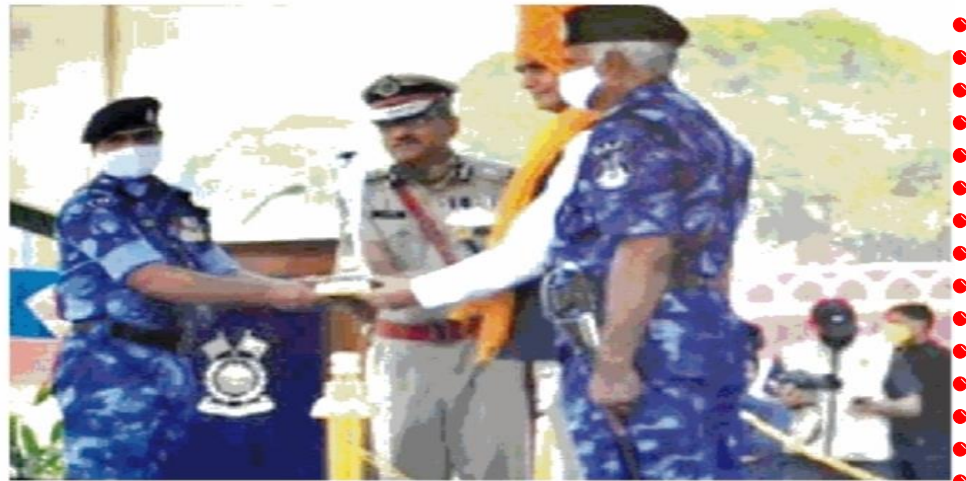
गृह राज्य मंत्री से सम्मान लेते द्वितीय कमान अधिकारी • जागरण

द्रुत कार्य बल के समस्त कर्मियों के वेतन, भत्ते व सभी जानकारी मोबाइल पर उपलब्ध कर ई-गवर्नेस को अमल में लाया जा रहा है। 28वें स्थापना दिवस के मौके पर भव्य परेड का आयोजन किया गया। इस अवसर पर एक से सात अक्टूबर तक सप्ताहव्यापी कार्यक्रम का आयोजन