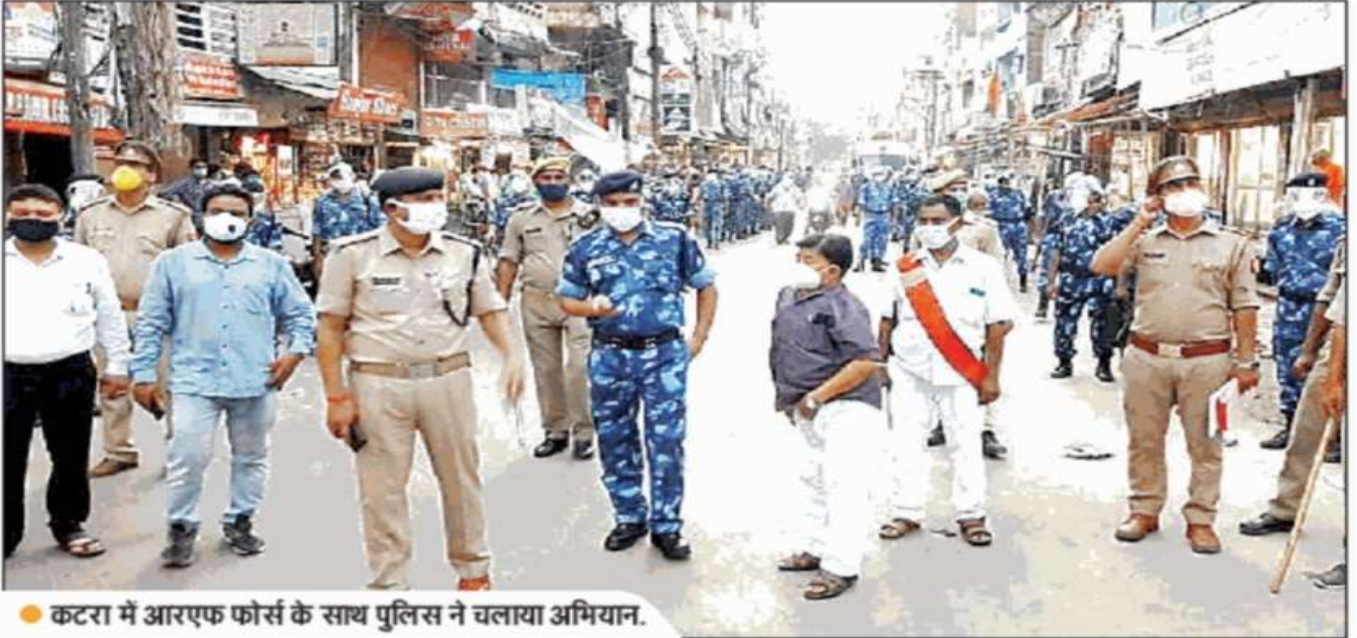
● कटरा में आरएफ फोर्स के साथ पुलिस ने चलाया अभियान.

कर्मलगंज एरिया में दुकानों के आगे इंक्रोचमेंट करने वाले दुकानदारों पर चला पुलिस का चाबुक, 15 को थमाया नोटिस