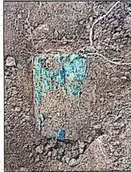
पारसनाथ में बुधवार को फूलीबागान के पास से बरामद आईईडी।