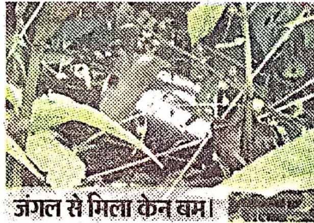
जंगल से मिला केन बम।