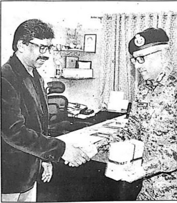
सीएम से मिलते सीआरपीएफ की डीजी