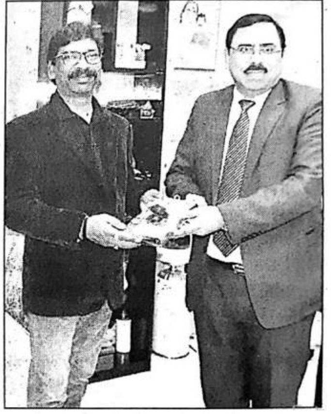
सीएम से मिलते सेल के अध्यक्ष