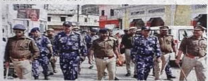
स्टमार्च करते पुलिस, पीएसी व आरएएफ के जवान » जाकरण