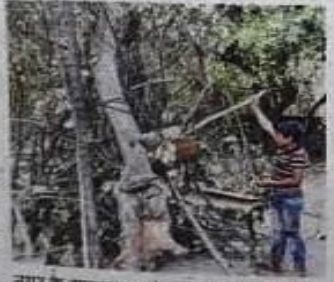
नगर के सहादतपुरा में होलिका में लकड़ी

गटमाला, टीसीआई मोड, औरंगाबाद होते हुए मिर्जाहादीपुरा पहुंचा। इस