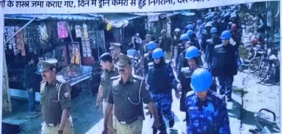
जीवनगढ़ बाजार में क्वार्टर इम्पेक्टर अरएएफ और पुलिस फोर्स के साथ प्लेगमार्च करते हुए।

बाहर के फोर्स की रवानगी शुरू : 23 फरवरी के उपद्रव के बाद 28 फरवरी को जुमे की नमाज को शांतिपूर्ण ढंग से सम्पन्न कराने, जीवनगढ़ क्वार्टर बाईपास का धरना उठवाने के लिए बुलाए गए फोर्स की रवानगी शुरू हो गई है। एसपी, एडिशनल एसपी, सीओ रैंक के अधिकारियों की रवानगी को वापस भेजा गया। उनका दोबारा जरूरत पड़ने पर बुलाया जा सकेगा।