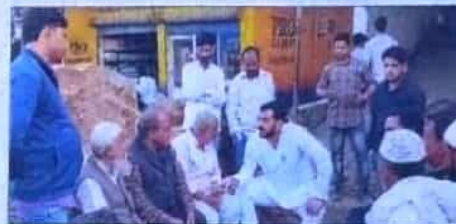
जीवनगढ़ के लोगों से बात करते समाजवादी युवजन सभा के प्रदेश सचिव।

अलीगढ़-अनूपराह रोड पर छह दिन से चल रहा था धरना अपनी दुकानों पर पहुंचे दुकानदार, सामान मिले गायब