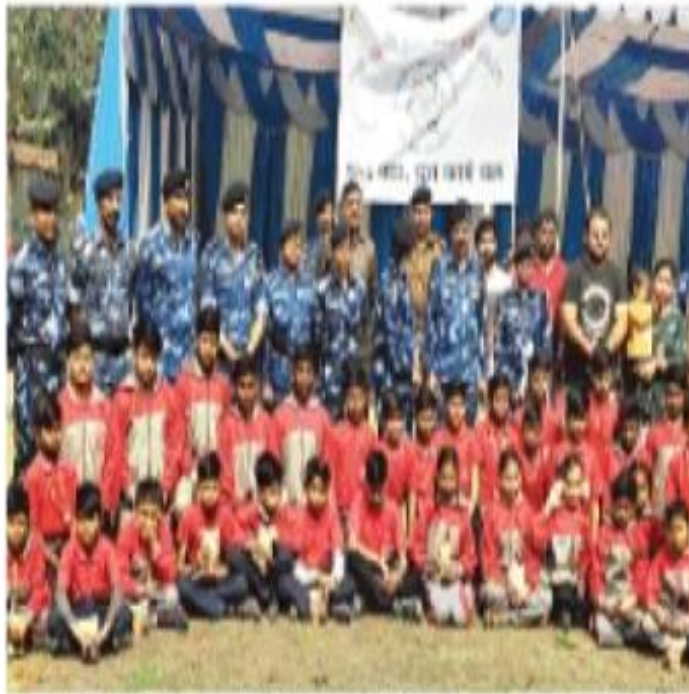
बवाना के कैप में रैपिड एक्शन फोर्स की ओर से आयोजित जागरूकता कार्यक्रम में भाग लेते स्कूली बच्चे व फोर्स के जवान