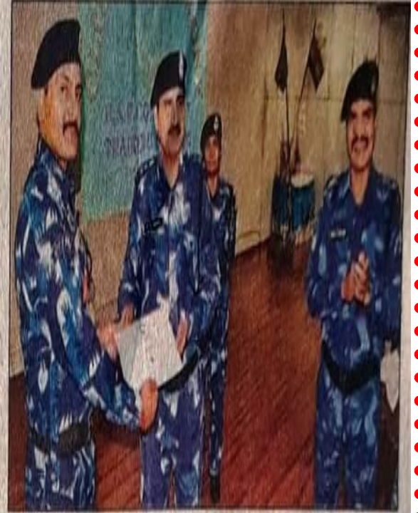
जवान को प्रमाण पत्र देते सीआरपीएफ के अधिकारी।