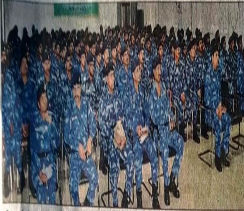
शनिवार को सुंदरनगर कैम्प में आयोजित प्रशिक्षण शिविर में शामिल रैफ के जवान।