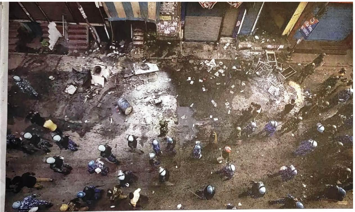
Rapid Action Force and Delhi Police personnel at Khajuri Khas, Tuesday. Gajendra Yadav