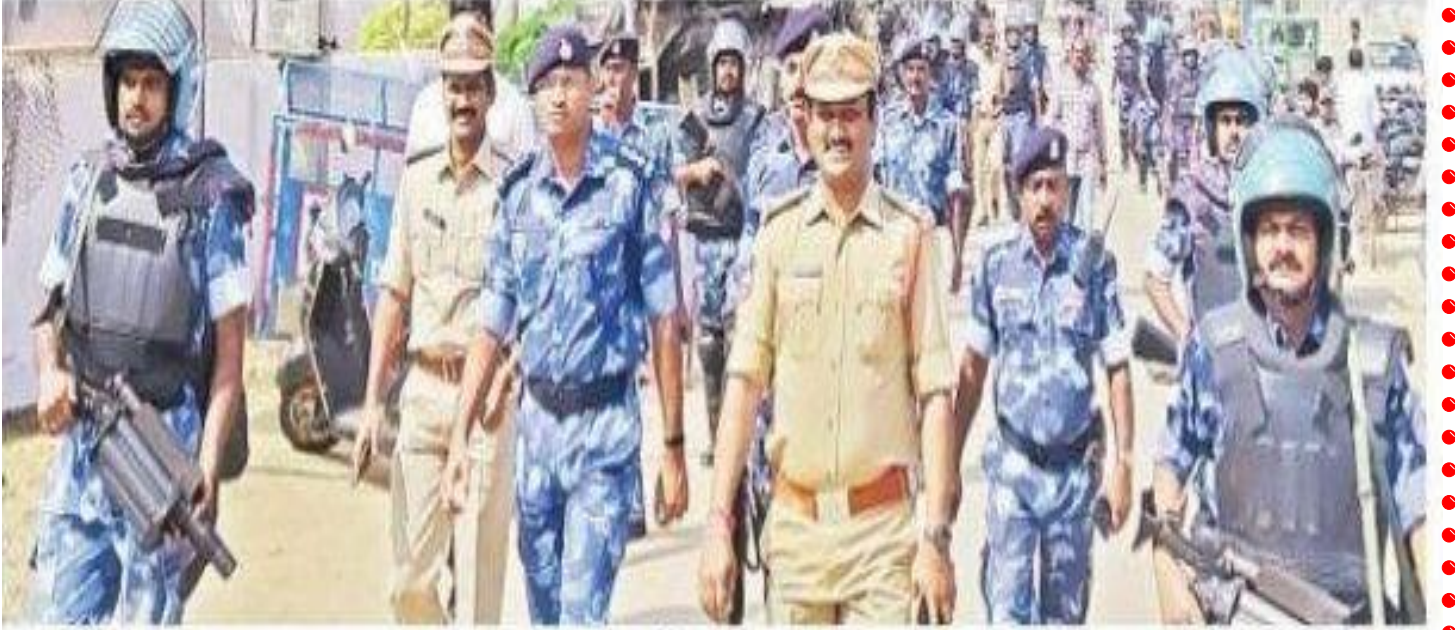
పట్టణంలో ఆర్పీఎఫ్ బలగాల కవాతు

నర్సాపూర్, ఫిబ్రవరి 5: నర్సాపూర్ పట్టణంలో ఆర్పీఎఫ్ ప్రత్యేక బలగాలు మీకు రక్షణగా మేమున్నామంటూ కవాతు నిర్వహించారు.