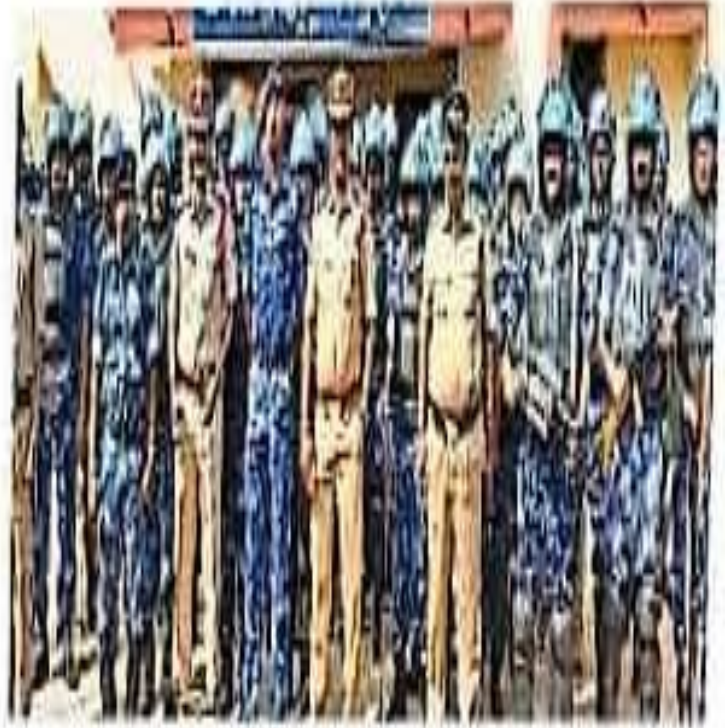
పోలీసు స్టేషన్లో ఆర్ఎఫ్ బలగాలు