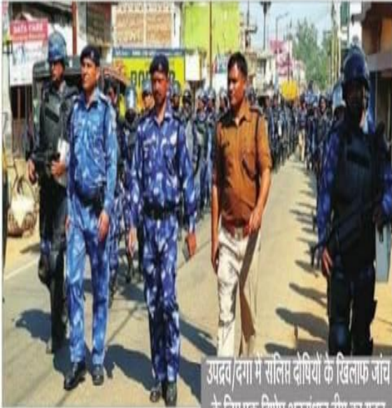
नवीन मेल संवाददाता

उपद्रव/दंगा में शांति दीपियों के खिलाफ जांच के लिए एक विशेष अनुसंधान टीम का गठन