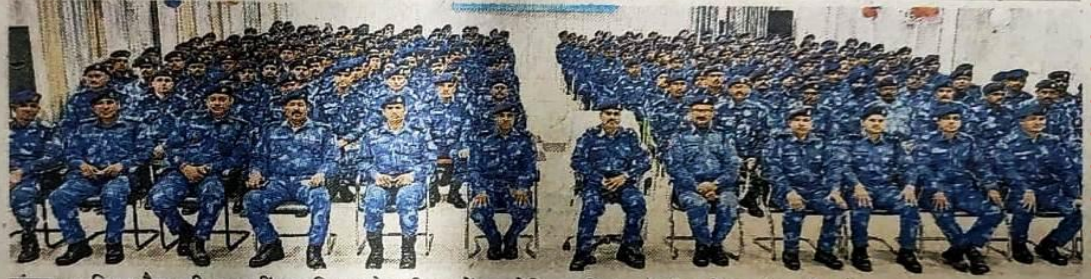
सुंदरनगर स्थित रैफ की 106वीं बटालियन के परिसर में आयोजित प्रशिक्षण शिविर में पदाधिकारी और जवान।

इससे वे नई चुनौतियों का सामना कर सकेंगे। जवानों को दंगों से निपटने के लिए दंगा नियंत्रण ड्रिल और रैफ के विभिन्न प्रकार के दंगा निरोधक हथियार, न्यूनतम बल प्रयोग सिद्धांत, धैर्य, मानवाधिकार विधि और विशेष वाहन जैसे वज्र, वरुण वाहन (वाटर केनन), फायर टैंडर, विशेष इक्विपमेंट और विभिन्न प्रकार के अश्रुगैस, हथगोलों