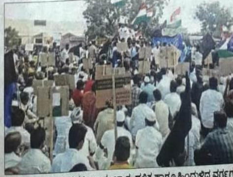
ಸೇಡಂ ಕಲಬುರಗಿ ವೃತ್ತದಲ್ಲಿ ಅಲ್ಪಸಂಖ್ಯಾತ, ದಲಿತ ಹಾಗೂ ಹಿಂದುಳಿದ ವರ್ಗಗಳ ಒಕ್ಕೂಟದಿಂದ ಸಿಎಎ ವಿರೋಧಿಸಿ ಸೋಮವಾರ ಪ್ರತಿಭಟನೆ ನಡೆಯಿತು.

ಕಾಂಗ್ರೆಸ್, ಜೆಡಿಎಸ್, ಸಿಪಿಎಂ, ಆರ್‌ಪಿಪಿ, ದಿಎಸ್‌ಪಿ ಪಕ್ಷಗಳು, ಮಾದಿಗ ದಂಡೋರ, ದಲಿತ ಸಂಘರ್ಷ, ಭಾರತೀಯ ಮುಕ್ತಿ ಮೋರ್ಚಾ, ಕೋಲಿ ಸಮಾಜ, ಕುರಬ ಸಮಾಜ, ಭಾರತೀಯ ಭಿಮ ಆರ್ಮಿ, ವೀರಶೈವ ಲಿಂಗಾಯತ ಸಮಾಜ, ಬಂಜಾರ, ಭೋವಿ ಸಮಾಜ, ಸಮಾಜ ಜಾಗರಣ ಮಂಚ್, ಅಕ್ಷ-ಹದೀಸ್, ಜಮಾತೇ-ಇಸ್ಲಾಂ-ಹಿಂದ್, ಮುಸ್ಲಿಂ ಅಭಿವೃದ್ಧಿ ಸಮಿತಿ, ಜಂಗಮ್ ಸಮಿತಿ, ನಮಲ್ ಸೊಸೈಟಿ, ದಾರುಲ್-ಉಲ್-ಹುಸೇನಿಯ, ಮಾನವ ಬಂಧುತ್ವ ವೇದಿಕೆ, ಟಿಪ್ಪು ಸುಲ್ತಾನ್ ಕಮಿಟಿ, ಎಪಿಜಿ ಅಬ್ದುಲ್ ಕಲಾಂ ಸಂಘ ಸೇರಿ ವಿವಿಧ ಸಂಘಟನೆಗಳು ಬಂದ್‌ಗೆ ಬೆಂಬಲಿಸಿ ಪ್ರತಿಭಟನೆಯಲ್ಲಿ ಪಾಲ್ಗೊಂಡಿದ್ದವು.