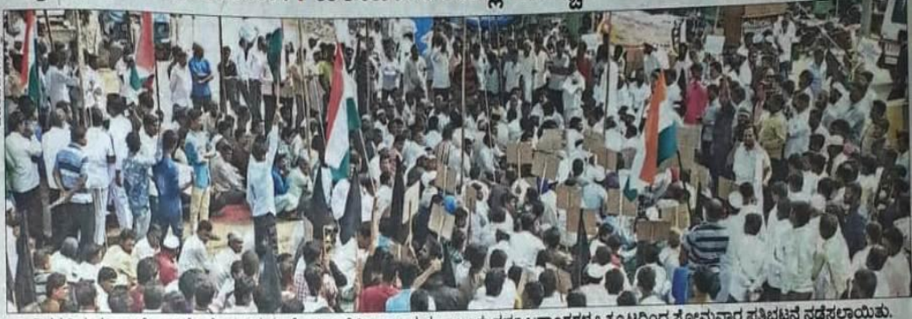
ಪೌರತ್ವ ತಿದ್ದುಪಡಿ ಕಾಯ್ದೆ ವಿರೋಧಿಸಿ ಚಿಂಚೋಳಿ ಬಸ್ ನಿಲ್ದಾಣ ಎದುರು ತಾಲೂಕು ಸರ್ವ ಜನಾಂಗಗಳ ಒಕ್ಕೂಟದಿಂದ ಸೋಮವಾರ ಪ್ರತಿಭಟನೆ ನಡೆಸಲಾಯಿತು.

■ ವಿಜಯವಾಣಿ ಸುದ್ದಿಬಿಲ್ಡ್ ಚಿಂಚೋಳಿ ಧರ್ಮ ಹಾಗೂ ಜಾತಿ ಆಧಾರದ ಮೇಲೆ ಜಾರಿಗೆ ತರುವ ಪೌರತ್ವ ತಿದ್ದುಪಡಿ ಕಾಯ್ದೆ ವಿರೋಧಿಸಿ ತಾಲೂಕು ಸರ್ವ ಜನಾಂಗಗಳ ಒಕ್ಕೂಟ ಸೋಮವಾರ ಕೆರೆ ನೀಡಿದ ಚಿಂಚೋಳಿ ಬಂದ್‌ಗೆ ಮಿಶ್ರ ಪ್ರತಿಕ್ರಿಯೆ ವ್ಯಕ್ತವಾಯಿತು. ಬೆಳಿಗ್ಗೆ 9ರಿಂದ ಮಧ್ಯಾಹ್ನ 2.30ರವರೆಗೆ ಪ್ರತಿಭಟನಾಕಾರರು ಬಸ್ ನಿಲ್ದಾಣ ಎದುರು ಕಡೆ ಬಟ್ಟೆ ಧರಿಸಿ ಪ್ರತಿಭಟನೆ ನಡೆಸಿ ಆಕ್ರೋಶ ವ್ಯಕ್ತಪಡಿಸಿದರು. ಕೇಂದ್ರ ಮತ್ತು ರಾಜ್ಯ ಸರ್ಕಾರಗಳು ಜನವಿರೋಧಿ ನೀತಿ ಕೈ ಬಿಡಬೇಕು. ಧರ್ಮ-ಧರ್ಮಗಳ ಮಧ್ಯೆ ವಿಷ ಬೀಜ