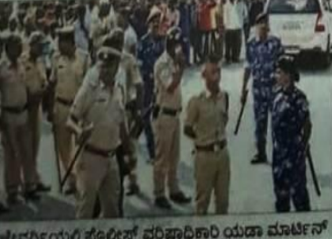
ಜೇವರ್ಗಿಯಲ್ಲಿ ಪೊಲೀಸ್ ಪರಿಷ್ಕಾರಿ ಯಡಾ ಮಾರ್ಚ್