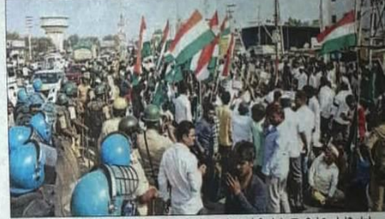
ಪೌರತ್ವ ತಿದ್ದುಪಡಿ ಕಾಯ್ದೆ ವಿರೋಧಿಸಿ ಜೇವರ್ಗಿಯ ಬಸವೇಶ್ವರ ಬೊನ್ಲೆ ಪ್ರಗತಿಪರ ಸಂಘಟನೆಗಳ ನೇತೃತ್ವದಲ್ಲಿ ಸೋಮವಾರ ಬೃಹತ್ ಪ್ರತಿಭಟನೆ ನಡೆಸಲಾಯಿತು.