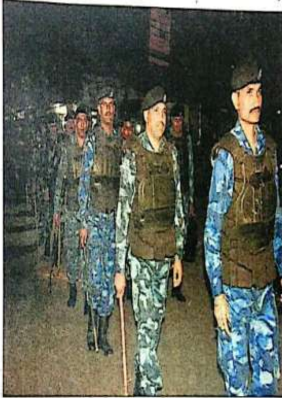
छह दिसंबर मददेनजर फोर्स ने हापुड़ अट्रेंड पर फ्लैग मार्च किया।

पुलिस-प्रशासनिक अधिकारियों ने छह दिसंबर को लेकर सुरक्षा व्यवस्था की समीक्षा की। सभी को निर्देश दिया कि पूरे जिले में मिश्रित आबादी क्षेत्र में मौजूद धार्मिक स्थलों पर सुरक्षा व्यवस्था की जाए। सरधना, मवाना, किठौर के अलावा शहर में भी 40 से ज्यादा ऐसी जगहों को चिह्नित किया गया है, जहां विशेष तौर पर पुलिस को निगरानी का निर्देश दिया गया है। देहात में सभी थाना प्रभारियों और सीओ को कहा गया कि सभी ग्राम प्रधान और चौकीदारों से संपर्क कर पूरी व्यवस्था बनाएं, साथ ही गांवों में डॉ. अंबेडकर की प्रतिमाओं पर रात को चौकीदारों की ड्यूटी लगाने और पुलिस टीम की गश्त की व्यवस्था करने