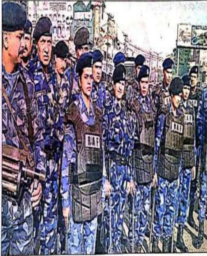
छह दिसंबर को शहर में जगह-जगह पुलिस फोर्स और आरएफ तैनात रही।