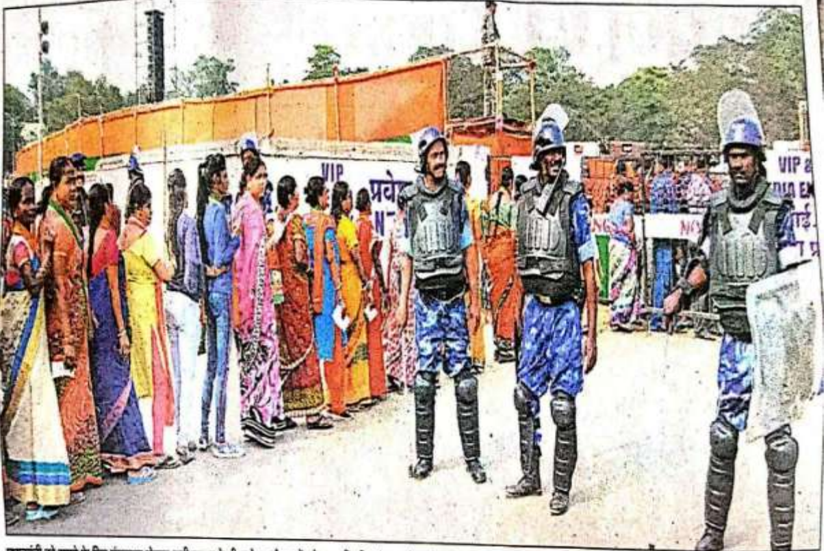
प्रधानमंत्री को सुनने के लिए मंगलवार दोपहर कड़ी सुरक्षा के बीच गोपाल मैदान में प्रवेश करती महिलाएं। इस दौरान तैनात रफ के जवान।

मैदान के अंदर जो भी प्रवेश करता, उसे मेटल डिटेक्टर के घेरे से पार करना पड़ रहा था। आम लोगों के लिए मैदान के अंदर जाने के तीन गेट थे और तीनों गेट के बाहर जांच के बाद ही लोगों को अंदर जाने की इजाजत मिल रही थी। पहले जैकेट-शर्ट वालों को रोककर मैदान के तुलसी भवन वाले गेट पास एंट्रेंस को तैनात था और वहां से शुरुआती एक घंटे में जो भी लोग आता जैकेट, शर्ट, शॉल या फिर मफलर लपेटे अंदर जाने की कोशिश कर रहे थे, उन्हें रोक दिया जा रहा था। उन्हें हियवत दी जा रही थी कि या तो वे अपने कपड़े को बाहर रखकर ही या फिर सभा स्थल के अंदर काले कपड़े पहनकर न जाएं। इस दौरान कुछ घंटे भी लोग थे, जो अपना टाईशर्ट या शर्ट उतारकर सैंडो गंजों में ही अंदर जाने का प्रयत्न करने लगे। इसको लेकर काफी देर तक अफरा-तफरी मची रही। बाद में उस गेट पर आर्य वीथी अधिकारियों ने काला जैकेट या अन्य काले कपड़े पहनकर आए लोगों को जाने की अनुमति दे दी। गेट पर तैनात पुलिस जवानों से कहा गया कि सिर्फ काला झंडा, काला मफलर या काला ऐसा कोई कपड़ा लेकर अंदर जाने नहीं दें, जिसे लहटाकर विरोध किया जा सके।